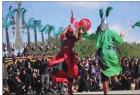
■ آگاهی‌های مشترک و تداوم آنها