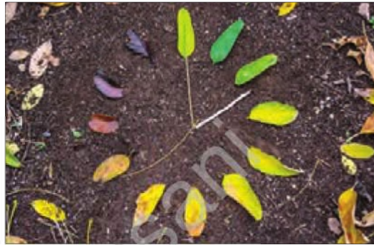
■ ورود پدیده های طبیعی و ماوراءطبیعی به جهان اجتماعی