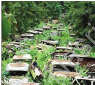
■ اقدامات شتاب زده انسان در مواجهه با طبیعت