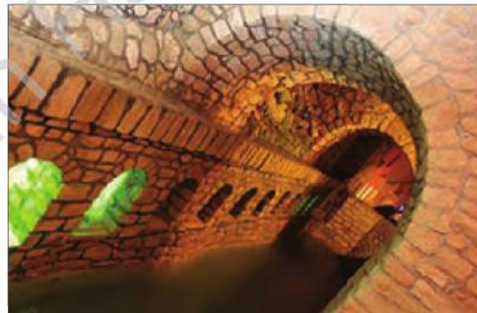
■ قنات. ابتکار ایرانیان

دانستید ورود پدیده های طبیعی به جهان اجتماعی باعث گسترش آن می شود؛ ولی جهان اجتماعی می تواند از این هم گسترده تر شود. آیا می دانید چگونه؟ 2) شناخت خداوند، فرشتگان و جهان ماوراء طبیعی، آرمان ها و ارزش های زندگی آدمیان را تغییر می دهد و کنش های اجتماعی آنان را دگرگون می سازد.