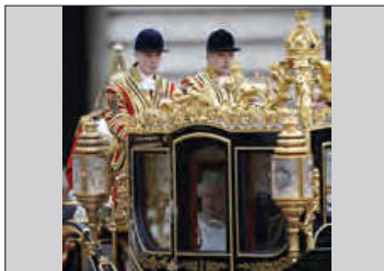
■ مشروطه سلطنتی انگلستان

گفته شد که جهان اجتماعی دارای هویت سیاسی است. جهان اجتماعی با پذیرش یک نظام سیاسی خاص، هویت سیاسی پیدا می کند. نظام های سیاسی انواع گوناگونی دارند. با چه ملاک هایی می توان نظام های سیاسی را دسته بندی کرد و چه انواعی برای نظام های سیاسی وجود دارد؟