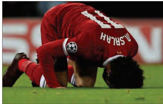
■ محمدصلاح، فوتبالیست مصری، آن قدر در میان مردم مصر محبوبیت دارد که در انتخابات ریاست جمهوری بدون اینکه نامزد شود، حدود یک میلیون نفر از مردم به او رأی داده بودند.