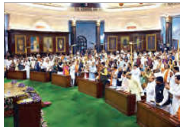
■ پارلمان هند