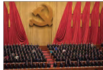
■ حزب کمونیست چین