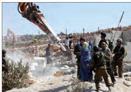
■ اجرای طرح های توسعه طلبانه رژیم اشغالگر قدس و تلاش برای تغییر ترکیب جمعیتی سرزمین های اشغالی

۴ رژیم اشغالگر قدس برای تغییر ترکیب جمعیتی سرزمین های اشغالی و بیشتر شدن تعداد یهودیان نسبت به مسلمانان و اجرای طرح های توسعه طلبانه خود، ضمن حذف فیزیکی اعراب مسلمان و آواره کردن آنها به جذب مهاجران یهودی از سراسر دنیا و کوچ دادن آنها به سرزمین های اشغالی اقدام می کند.