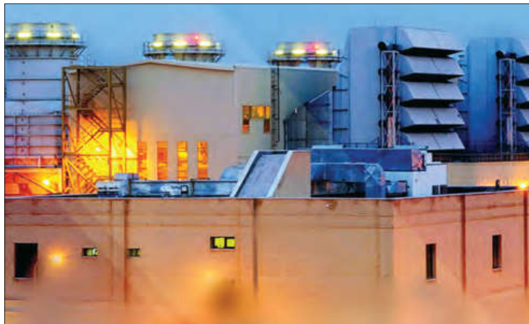
■ مجتمع تولیدی مپنا

تاثیر سرمایه‌های نفتی بر اقتصاد را بنویسید. دی 99