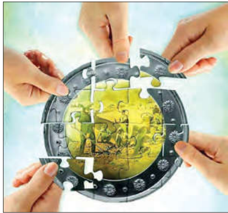
حضور فعال و مؤثر افراد جامعه در شکل‌گیری هویت اقتصادی

به آن دسته از فعالیت‌های روزمره که برای تهیه و تولید وسایل ضروری زندگی و رفع نیازهای مادی و معیشتی خود و دیگران انجام می‌دهیم، کنش اقتصادی می‌گویند. کنش‌های اقتصادی ما، بخشی از کنش‌های اجتماعی هستند؟