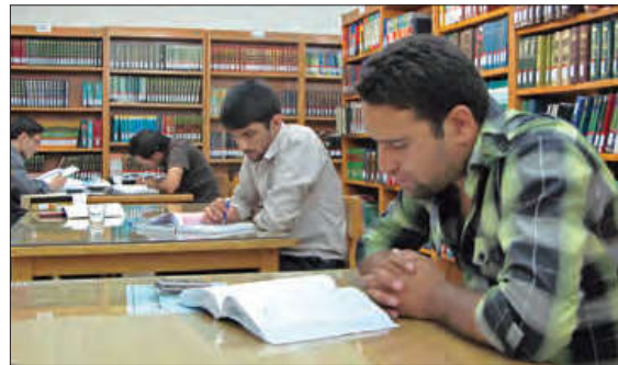
■ فرصت‌ها و محدودیت‌ها