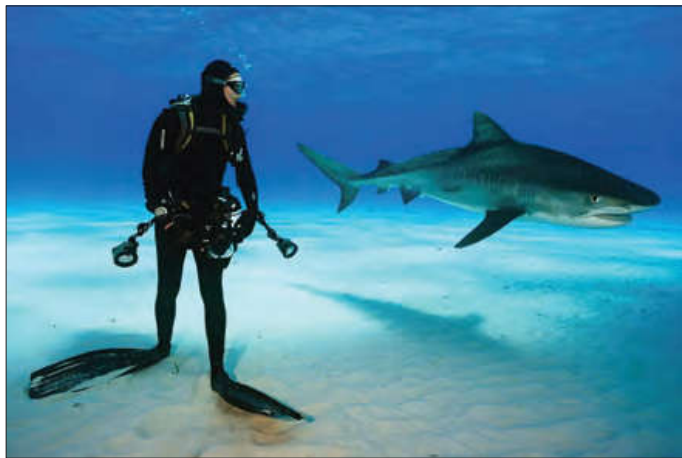
■ تسلط بر طبیعت

برخی از جهان‌های اجتماعی، استعدادها و سرمایه‌های معنوی انسان را نادیده می‌گیرند یا فرصت شکوفایی فطرت آدمی را فراهم نمی‌آورند. برخی دیگر، مانع بسط ابعاد دنیوی وجود انسان می‌شوند و نسبت به نیازهای مادی و دنیوی انسان بی‌توجه‌اند و با رویکرد دنیاگریز خود، از توانمندی‌های آدمی برای آباد کردن این جهان استفاده نمی‌کنند. ۱ در فعالیت آخر درس اول از شما خواسته شده است آیه ۳۸ سوره مدثر را تحلیل کنید. اکنون دوباره تلاش کنید و این آیه را دقیق‌تر تحلیل کنید.