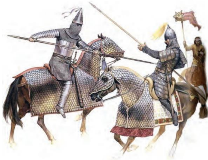
○ سواره نظام سنگین اسلحه اشکانی

سپاه، تیر و کمان و نیزه بود. دلیل توانمندی سواره نظام اشکانی، پیشینه صحراگردی‌شان بود که به آنان توانایی جنگیدن و تحمل مشقت را داده بود. (۳۲) اشکانیان به تدریج، سواره نظام دارای سلاح سنگین نیز تشکیل دادند که مجهز به زره و کلاه خود بود. استفاده از صدای طبل نیز در آغاز حملات سپاه اشکانی معمولاً وحشت بسیاری در لشکر دشمن ایجاد می‌کرد و نظم آنها را به هم می‌ریخت. سورنا، سردار معروف اشکانی، با همین روش هراس بزرگی در سپاه کراسوس رومی ایجاد کرد و در نبرد حران (۵۳ ق.م.) پیروز شد. (۳۳) ساسانیان : با به قدرت رسیدن خاندان ساسانی، سپاه دائمی و مجهزی به وجود آمد. اصلی‌ترین بخش این سپاه را سواره نظام سنگین اسلحه زره پوش تشکیل می‌داد که به آن آسواران گفته می‌شد. سر تا پای آسواران با زره‌های فلزی پوشیده