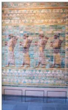
○ نگاره کمان داران هخامنشی - کاخ آپادانای شوش