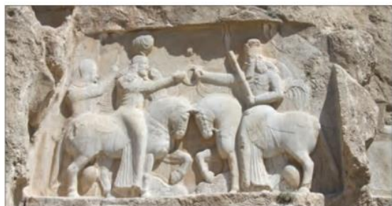
○ اردشیر بابکان، بنیانگذار سلسله ساسانیان (سمت چپ) هنگام دریافت حلقه شاهی از اهوره‌مزدا (سمت راست) - نقش رستم

با توجه به شیوه حکومت اشکانیان، دلیل بیاورید که چرا تشکیلات اداری (دیوان‌سالاری) در دوران آنان، به گستردگی تشکیلات اداری دوران هخامنشیان و ساسانیان نبود؟