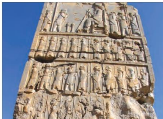
سنگ‌نگاره داریوش یکم و درباریان - تخت جمشید

ادعا می‌کردند که به خواست اهوره‌مزدا به مقام پادشاهی دست یافته‌اند و به یاری او بر کشور فرمان می‌راندند. این ادعا به نوعی به حکومت آنان جنبه دینی می‌داد و مردم را تشویق و ترغیب به فرمان‌برداری از آنان می‌کرد. ۴