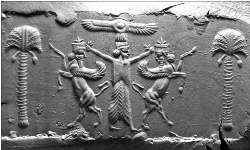
● مهر دوره هخامنشی؛ نامه های اداری هخامنشیان به خط و زبان آرامی نگارش یافته و مهر می شد. منصب مَهرداری، یکی از مناصب دیوان شاهی بود.

در زمان داریوش یکم، حکومت هخامنشی به نهایت گسترش خود رسید و این پادشاه هوشمند و لایق، برای سامان دادن به امور و اداره بهتر قلمرو پهناور تحت فرمان خود، نظام اداری منظم و کارآمدی را پدید آورد. از این رو،