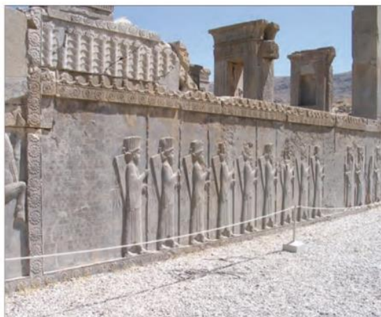
○ سنگ نگاره سربازان سپاه جاویدان - تخت جمشید

ناوهای جنگی را پارسیان و مادی ها بر عهده داشتند. ۳۱ اشکانیان: اشکانیان به نیروی سواره نظام اهمیت فراوان می دادند و در سپاه اشکانی، نیروی پیاده نظام نقش چندانی نداشت. اساس تشکیلات نظامی اشکانیان، سواره نظام چابکی بود که در هنگام سواری تیراندازی می کرد و باعث از هم پاشیدن لشکر دشمن می شد. مهم ترین جنگ افزارهای این