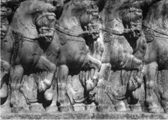
● سنگ نگاره سواره نظام ساسانی - بیشاپور، استان فارس

۳۶) در دوران ساسانی، مدارس به نام ارتشتارستان وجود داشت که افراد ارتش در آنجا آموزش می‌دیدند. برخی شواهد نشان می‌دهد که در آن زمان، کتابچه‌هایی با موضوع‌های تخصصی درباره آموزش‌های نظامی از قبیل تشکیلات قشون، فنون جنگ، تیراندازی با کمان، تغذیه سپاهیان و مراقبت از اسبان وجود داشته که مریبان از آنها برای آموزش سربازان استفاده می‌کرده‌اند. ( ۳۶