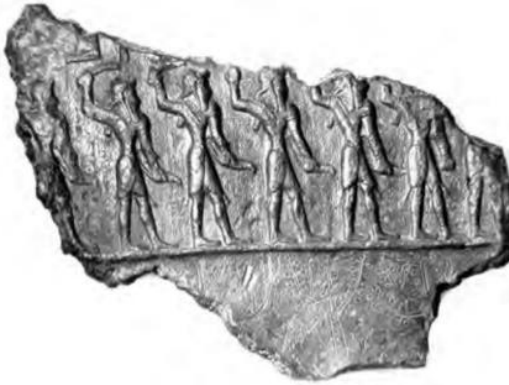
○ نقش برجسته برنزی هفت جنگجو - شوش، قرن ۱۲ ق.م.

ایلامیان در بخش شرقی قلمرو خود، واقع در استان فارس امروزی نیز پایتخت دیگری به نام انشان یا انزان داشتند. سیمش از دیگر شهرهای ایلام است که احتمالاً بر جای خرم آباد کنونی قرار داشته است. ۱۳)