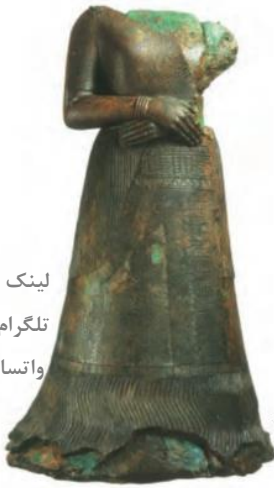
○ پیکره ملکه نپیرآسو، همسر اونتش گل (پادشاه ایلام)

۱۴) یکی از ویژگی‌های مهم تمدن ایلامی و در واقع تمدن کهن ایرانی، مقام و منزلت والایی است که زنان داشته‌اند. به‌طور کلی در جوامع باستانی فلات ایران، زنان موقعیت اجتماعی ممتازی داشتند و دارای قدرت و نفوذ فراوان بودند. زنان در کارهای مهم جامعه، نقش اساسی و تعیین‌کننده داشتند. نقوش و پیکره‌های برجای مانده از دوره ایلامی نشان می‌دهد که زنان در امور اجتماعی و اقتصادی و مراسم رسمی سیاسی و دینی حضور چشمگیری داشته‌اند. (۱۴)