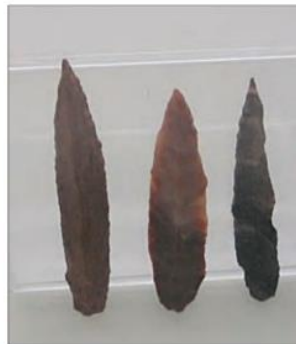
تیغه سنگی، غار یافته - لرستان، پارینه سنگی جدید (۴۰ تا ۱۸۰۰۰ سال پیش)