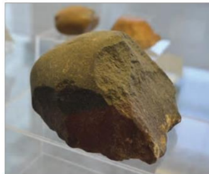
ابزار سنگی، پارینه سنگی قدیم - شیوه تو - مهاباد