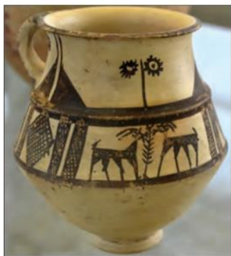
ظرف سفالی، ۳۰۰۰ ق.م - تپه گیان نهاوند

ب- از نخستین روستاها تا نخستین شهرها: همان گونه که در درس ۴ خواندید، (کاوش‌های باستان‌شناسی اخیر در محوطه باستانی چغاگلان در شهرستان مهران نشان داده است که ساکنان نواحی کوهپایه‌ای زاگرس، نخستین مردمانی بوده‌اند که حدود ۱۲ هزار سال پیش شروع به کشت گیاهانی مانند جو و گندم و اهلی کردن جانورانی مثل بز و گوسفند کردند. این اقدام به‌منزله ورود انسان از دوره شکار و گردآوری خوراک به دوره یک‌جانشینی و تولید خوراک در فلات ایران است.) ۳ با روی آوردن گروه‌هایی از مردم به کشاورزی و دامپروری، به تدریج سکونتگاه‌ها و روستاهایی نخست در غرب و سپس در دیگر مناطق ایران پدید آمد. به نقشه صفحه ۷۱ بنگرید.