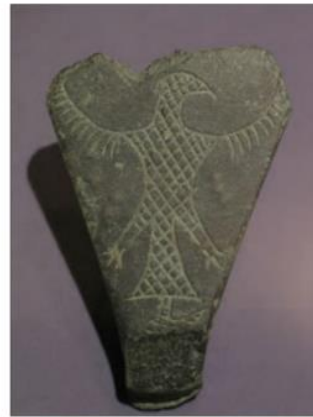
نمونه‌ای از اشیاء سنگ صابونی تپه یحیی - بافت

با استفاده از گل و سنگ و سرانجام خشت، بناهای محکم‌تری بسازند. آنها سطح دیوارها را با کاهگل می‌پوشاندند و گاه رنگ‌آمیزی می‌کردند و سقف خانه‌ها را معمولاً با تیرهای چوبی می‌پوشاندند.