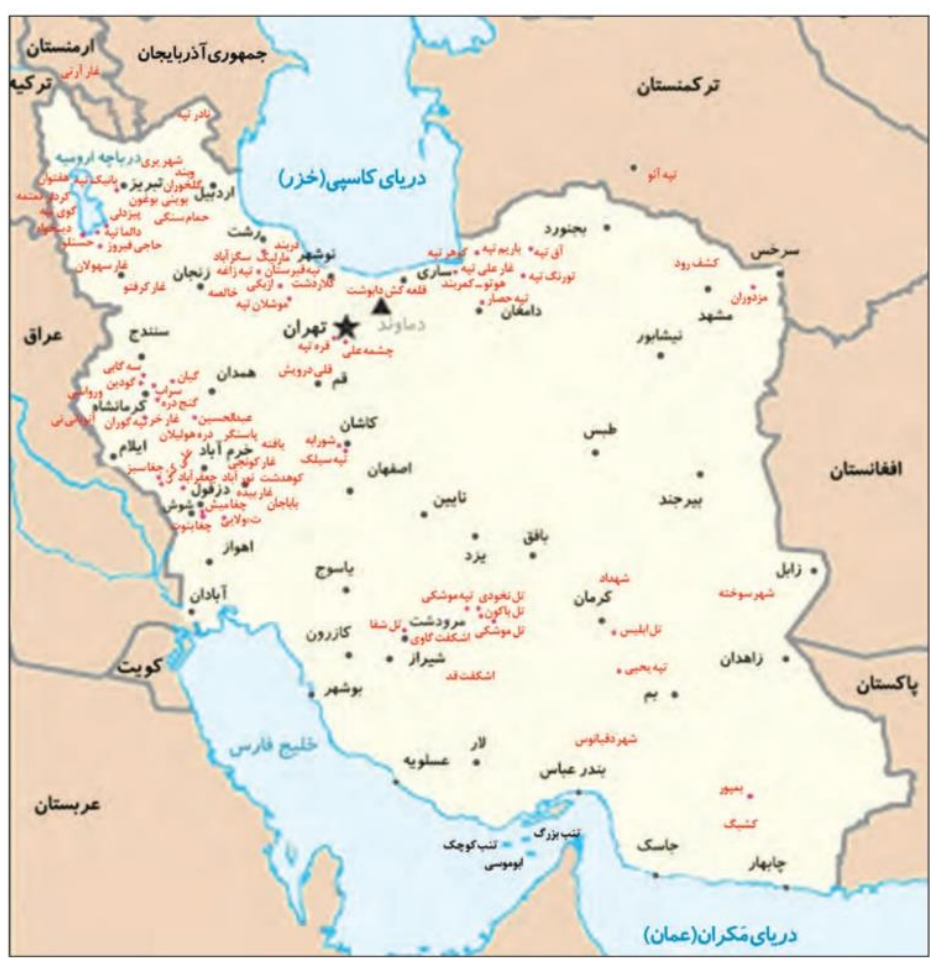
● سکونتگاه‌های پیش‌آریایی ایران

(موقعیت جغرافیایی فلات ایران نیز تأثیر زیادی بر شکل‌گیری تاریخ و تمدن آن داشته است. ایران به‌واسطهٔ موقعیت جغرافیایی خاص خود در جنوب غربی آسیا، پل ارتباطی شرق و غرب جهان باستان بود. در عصر باستان، مهم‌ترین راه‌های زمینی و دریایی که تمدن‌ها و کشورهای بزرگ را به یکدیگر متصل می‌کردند، از میهن ما می‌گذشتند و خلیج فارس و دریای مکران نقش مهمی در برقراری ارتباط تجاری، سیاسی، نظامی و فرهنگی میان سرزمین‌های دور و نزدیک جهان آن روز داشتند. این موقعیت جغرافیایی، ایران گذاشته است.) ۱ پرسش