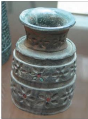
ظرفی از جنس سنگ صابونی - جیرفت

۶- اشیاء و ظروف سنگ صابونی، از دیگر مصنوعات است که توسط مردم برخی سکونتگاه‌های کهن به‌ویژه جیرفت