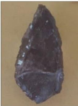
سنگ خراشنده - غار دو آشکفت کرمانشاه - پارینه سنگی میانی (۲۰۰ تا ۴۰۰۰۰ سال پیش)