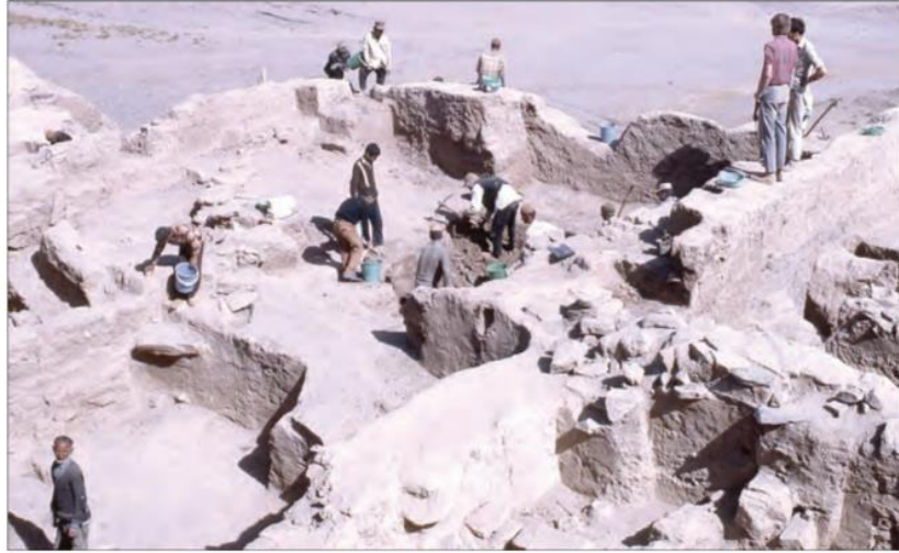
○ حفاری در محوطه باستانی گودین تپه - کنگاور

پدید آمدن شهرها: (در حدود ۵ هزار سال پیش، نخستین شهرها در فلات ایران به وجود آمد. شوش و چغامیش در خوزستان؛ شهداد و جیرفت در کرمان؛ شهر سوخته در سیستان و سیلک در کاشان از جمله این شهرها بودند.) ۸