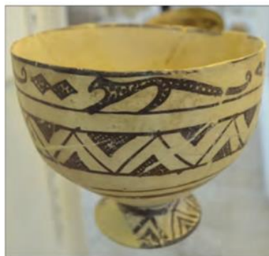
کاسه سفالی، ۴۰۰۰ ق.م - تپه حصار دامغان