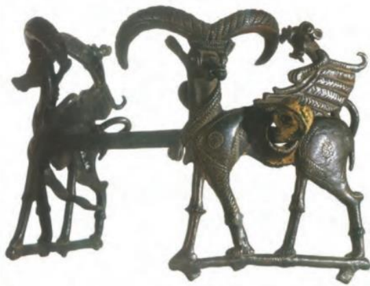
دهنه‌اسب، نمونه‌ای از ابزارهای مفرغی (برنزی) لرستان - ۷۰۰ ق.م

و تپه یحیی در استان کرمان، با مهارت و ظرافت تمام ساخته می‌شد. شواهد باستان‌شناسی نشان می‌دهد که سکونتگاه‌های مذکور از مراکز مهم تولید و صدور سنگ صابون به مناطق دور و نزدیک بوده‌اند.