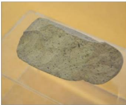
ابزار سنگی، پارینه سنگی قدیم - کشف‌رود - خراسان رضوی

الف - کهن‌ترین ساکنان فلات ایران: سابقه حضور انسان در فلات ایران به‌طور دقیق روشن نیست، اما بعضی پژوهشگران احتمال داده‌اند گروه‌هایی از جمعیت‌های انسانی از آفریقا، آسیای مرکزی، قفقاز و شبه‌قاره هند در دوران پارینه سنگی به سوی سرزمین ما مهاجرت کرده‌اند. کهن‌ترین نشانه و آثاری که از حضور انسان در ایران تاکنون کشف شده، مربوط به بستر کشف‌رود در نزدیکی مشهد در خراسان