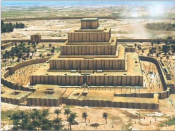
طرحی از معبد چغازنبیل - شوش

در دوره ایلام، معماری پیشرفت چشمگیری کرد و استفاده از آجر در ساختن بناها رایج شد. معبد چغازنبیل در نزدیکی شهر شوش، شاهکار معماری آن دوره به‌شمار می‌رود. این