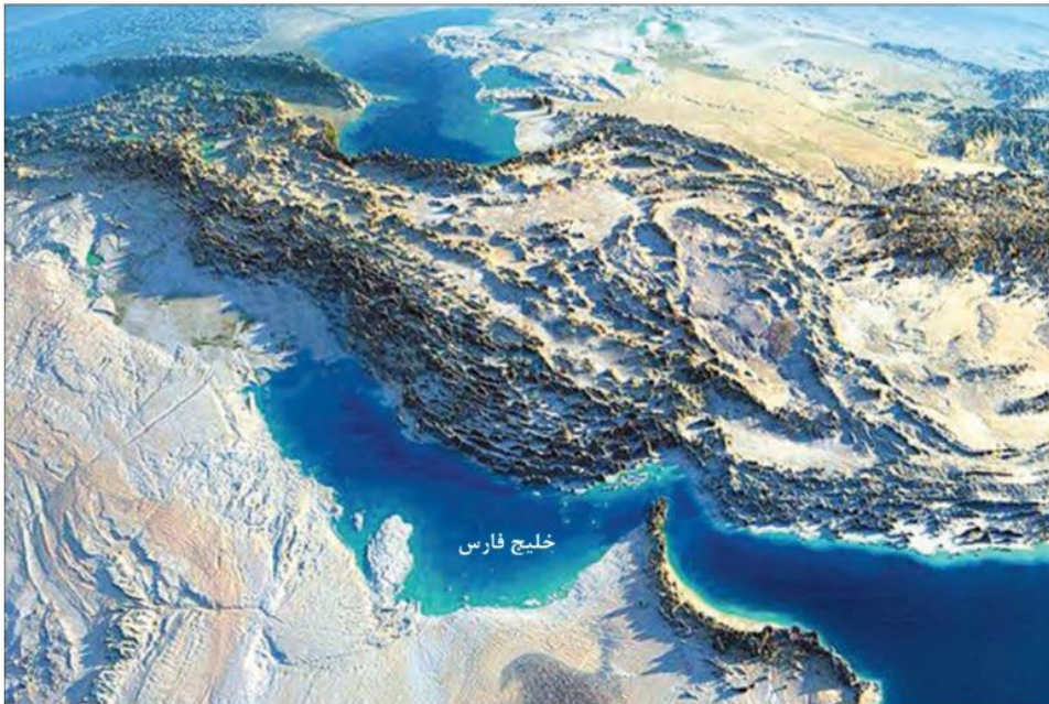
نقشه ماهواره ای فلات ایران

خواندید که عوامل جغرافیایی تأثیر بسزایی در پیدایش تمدن های نخستین و سیر رویدادها و تحولات تاریخی در سرزمین های مختلف داشته است. تاریخ و تمدن کهن ایران نیز به طرز چشمگیری از عوامل جغرافیایی تأثیر پذیرفته است. از این رو، برای مطالعه و شناخت کامل تاریخ و تمدن ایران، ناگزیر از توجه به جغرافیای آن هستیم. ۱) فلات ایران از شمال به دریای مازندران (خزر) و دریاچه آرال،