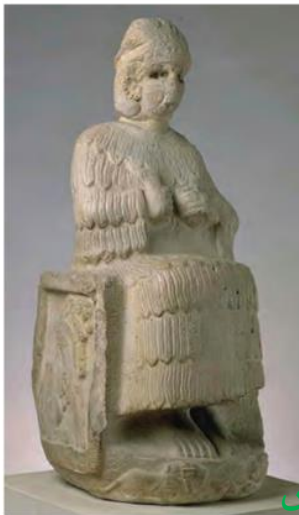
پیکره الهه ناروندی؛ در اسناد حقوقی و قضایی ایلام، سندها و تعهدات با سوگند به این الهه ضمانت می‌شد.

معبد چغازنبیل در سال ۱۳۱۲ ش. توسط یکی از کارمندان شرکت نفت ایران و انگلیس کشف و در فاصله سال‌های ۱۳۳۰ تا ۱۳۴۱ ش. توسط هیئتی از باستان‌شناسان، به سرپرستی رمان گیرشمن فرانسوی، از زیر خاک بیرون آورده شد. این اثر تاریخی در سال ۱۳۵۸ ش. از طرف یونسکو در فهرست میراث جهانی قرار گرفت.