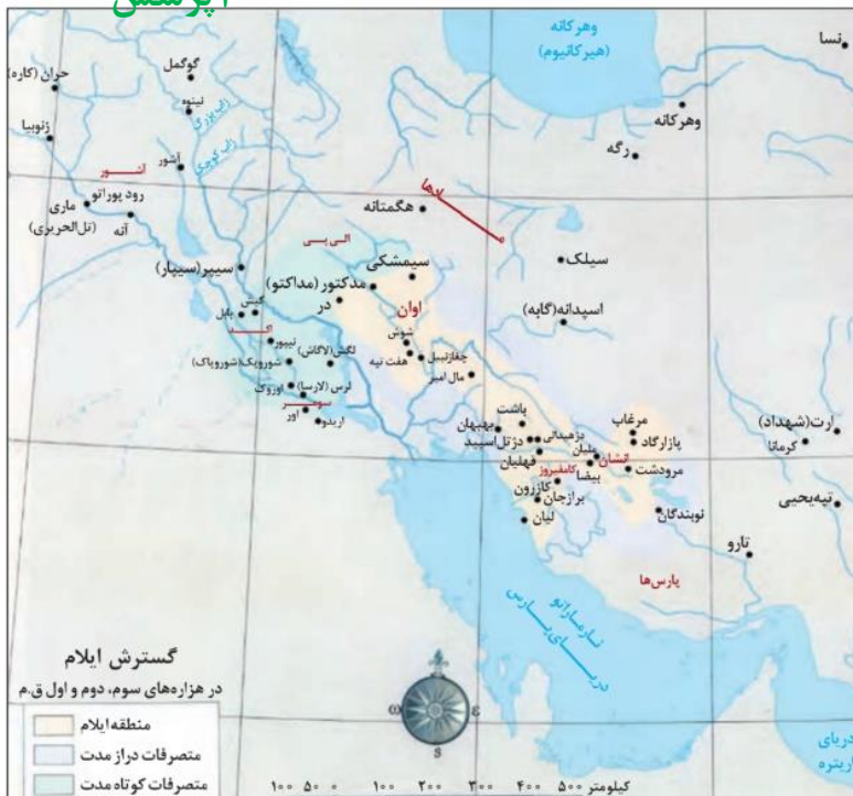
نقشه قلمرو حکومت ایلام