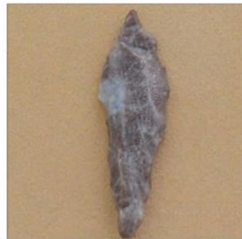
سنگ نوک تیز، هلیلان - ایلام، فراپارینه سنگی (۱۸ تا ۱۲۰۰۰ سال پیش)