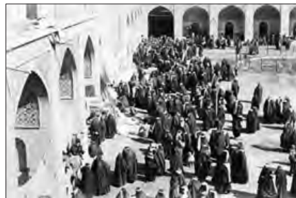
■ حضور فعال مردم در جنبش تنباکو به تبعیت از علما ■ نمایندگان دوره‌های نخست مجلس شورای ملی

برخورد رقابت‌آمیز عالمان دینی با قاجار، حرکتی اصلاحی بود. آنها برای اصلاح برخی رفتارهای پادشاهان قاجار تلاش می‌کردند. جنبش تنباکو نمونه‌ای موفق از فعالیت رقابت‌آمیز اصلاحی یک نمونه موفق، از فعالیت رقابت‌آمیز اصلاحی را نام ببرید