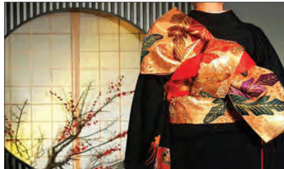
فرهنگ ژاپنی لباس کیمونو