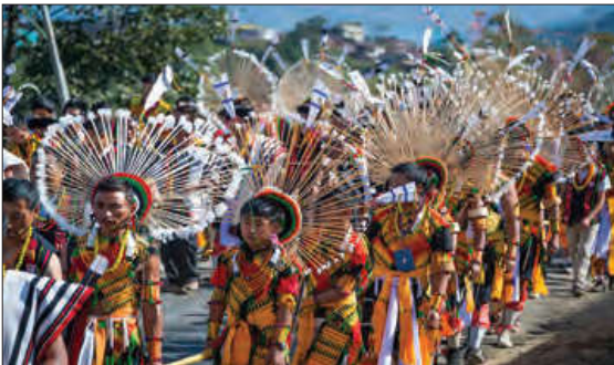
مراسم سرخ پوستان

فرهنگ‌هایی که عقاید و ارزش‌های آنها مربوط به قوم و منطقه خاصی است، از محدوده قومی و منطقه‌ای خود فراتر نمی‌روند و جهانی نمی‌شوند؛ مگر اینکه نسبت به سایر اقوام و مناطق نگاه سلطه‌جویانه داشته باشند.