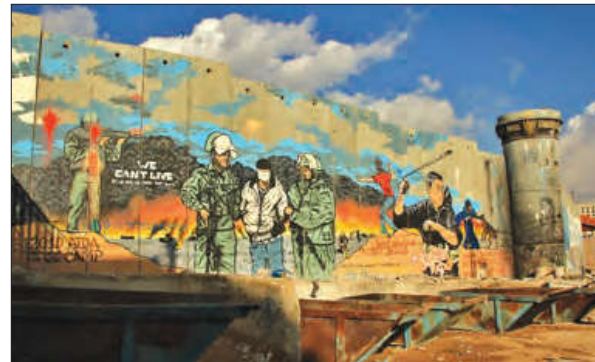
■ دیوار حائل بتونی در کرانه باختری و نقاشی هایی که توسط فلسطینیان بر روی آن کشیده شده است. اسرائیل ساخت این دیوار را از سال ۲۰۰۲ آغاز کرده است. ■ نابرابری