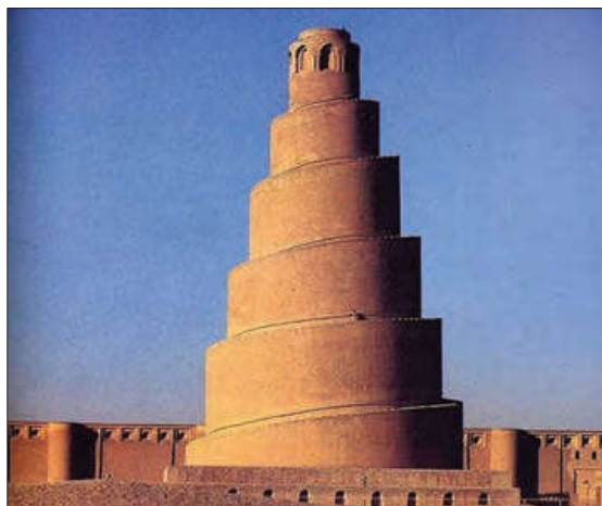
■ مسجد جامع سامرا از مساجد مشهور دوره عباسیان

فرهنگ جاهلی تا چه زمانی در برابر اسلام، آشکارا مقاومت کرده بود و چه زمانی ظاهر اسلامی به خود گرفت؟ فرهنگ جاهلی در عصر نبوی تا فتح مکه، در برابر اسلام آشکارا مقاومت کرده بود و از آن پس، به ناچار ظاهر اسلامی به خود گرفته بود. در دوران خلافت، ارزش‌ها، هنجارها و رفتارهای جاهلی دوباره در جامعه اسلامی نمایان شد و به تدریج قدرت در جامعه اسلامی را براساس روابط قبیله‌ای عقاید و ارزش‌های جهانی اسلام، فارغ از عملکرد قدرت‌های سیاسی، چگونه گسترش یافت؟ و عشیره‌ای شکل داد. اما عقاید و ارزش‌های جهانی اسلام، فارغ از عملکرد قدرت‌های سیاسی و با تلاش و کوشش عالمان مسلمان، از مرزهای جغرافیایی و سیاسی جوامع مختلف عبور کرد و بر قدرت‌های سیاسی که در این مناطق حضور داشتند، تأثیر گذاشت. فرهنگ اسلامی، به دلیل قدرت و غنای خود، گروه‌های مهاجم بیگانه را نیز درون خود هضم و جذب می‌کرد یا دست کم آنان را ناگزیر می‌ساخت که برای بقای خود، در ظاهر از مفاهیم و ارزش‌های دینی استفاده کنند.