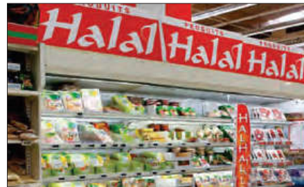
■ گسترش اسلام در کشورهای غربی