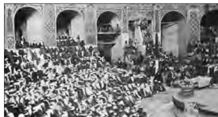
■ تکیه دولت؛ بنایی که برای برگزاری مراسم محرم و صفر و اجرای تعزیه به فرمان ناصرالدین شاه در تهران برپا شد.