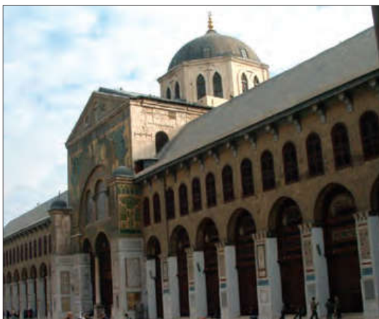
■ مسجد اموی در دمشق