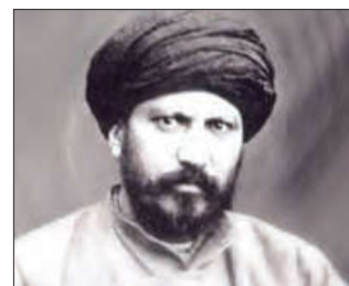
■ سید جمال‌الدین اسدآبادی، امام موسی صدر، شیخ ابراهیم زاکزاک

3 انقلاب اسلامی ایران، نقطه عطفی در بازگشت به فرهنگ اسلامی در جهان اسلام است.