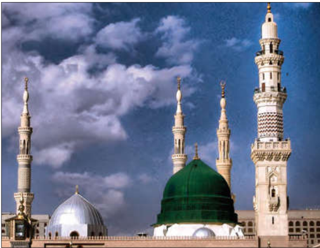
■ مسجد النبی در مدینه

وضعیت شبه جزیره عربستان قبل از ظهور اسلام از لحاظ فرهنگی و سیاسی چگونه بود؟