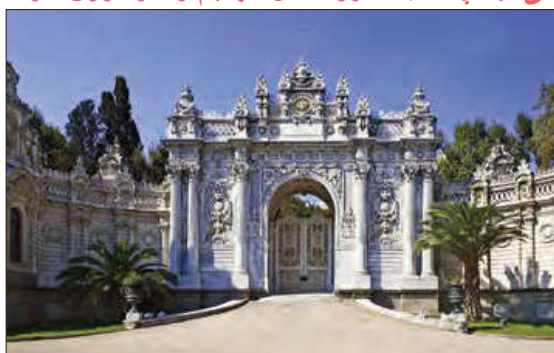
■ کاخ دلمه باغچه در استانبول، در بنای این کاخ که محل اقامت آخرین سلاطین عثمانی بوده، ۱۴ تن ورقه طلا به کار رفته است.

کدام قدرت‌ها مانع از آشکار شدن ظرفیت‌های اسلامی می‌شدند؟ چرا؟