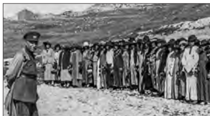
■ به دنبال تصویب قانونی در ۱۷ دی ۱۳۱۴ ه.ش، استفاده از چادر، روبنده و روسری برای زنان و دختران ایرانی ممنوع شد.

4 چاره‌ای جز حذف مظاهر فرهنگ اسلامی نداشت.