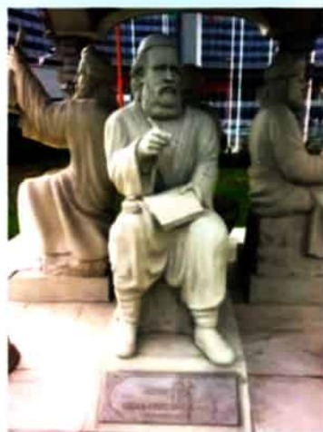
مجسمه خیام در مقر سازمان ملل متحد در وین