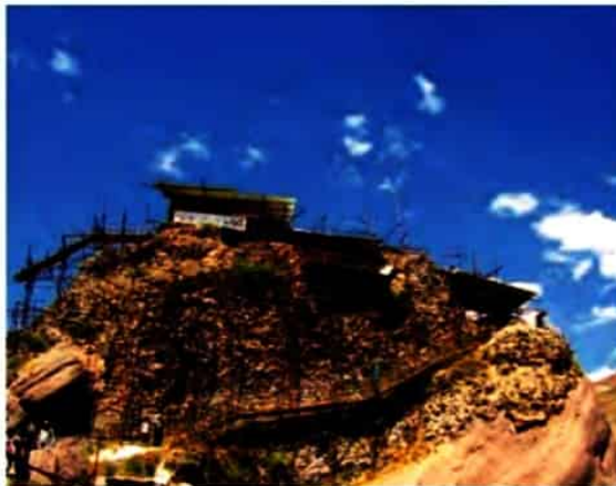
بقایای قلعه الموت

اسماعیلیان از قرن سوم هجری فعالیت تبلیغی خود را در ایران آغاز کردند و در دوران سلجوقیان به یک جریان مذهبی سیاسی نیرومند تبدیل شدند. رهبری اسماعیلیان ایران را در آن زمان حسن ضَبَّاح عهده‌دار بود و با خلافت فاطمیان مصر ارتباط داشت. حسن ضَبَّاح و جانشینان او با تصرف و یا بنای دژها در مناطق کوهستانی و صعب‌العبور، پایگاه‌های مستحکم و نفوذناپذیر برای خود ایجاد کردند و با سلجوقیان و خلافت عباسی به مبارزه پرداختند. دژ الموت در نزدیکی قزوین و دژ گردکوه در حوالی دامغان از جمله مهم‌ترین قلعه‌های آنان بود. اسماعیلیان هم‌زمان با مبارزات نظامی برای تبلیغ آیین خود و جذب مردم، خصوصاً شیعیان، به مذهب اسماعیلی و عقاید سیاسی خود فعالیت‌های فرهنگی زیادی انجام