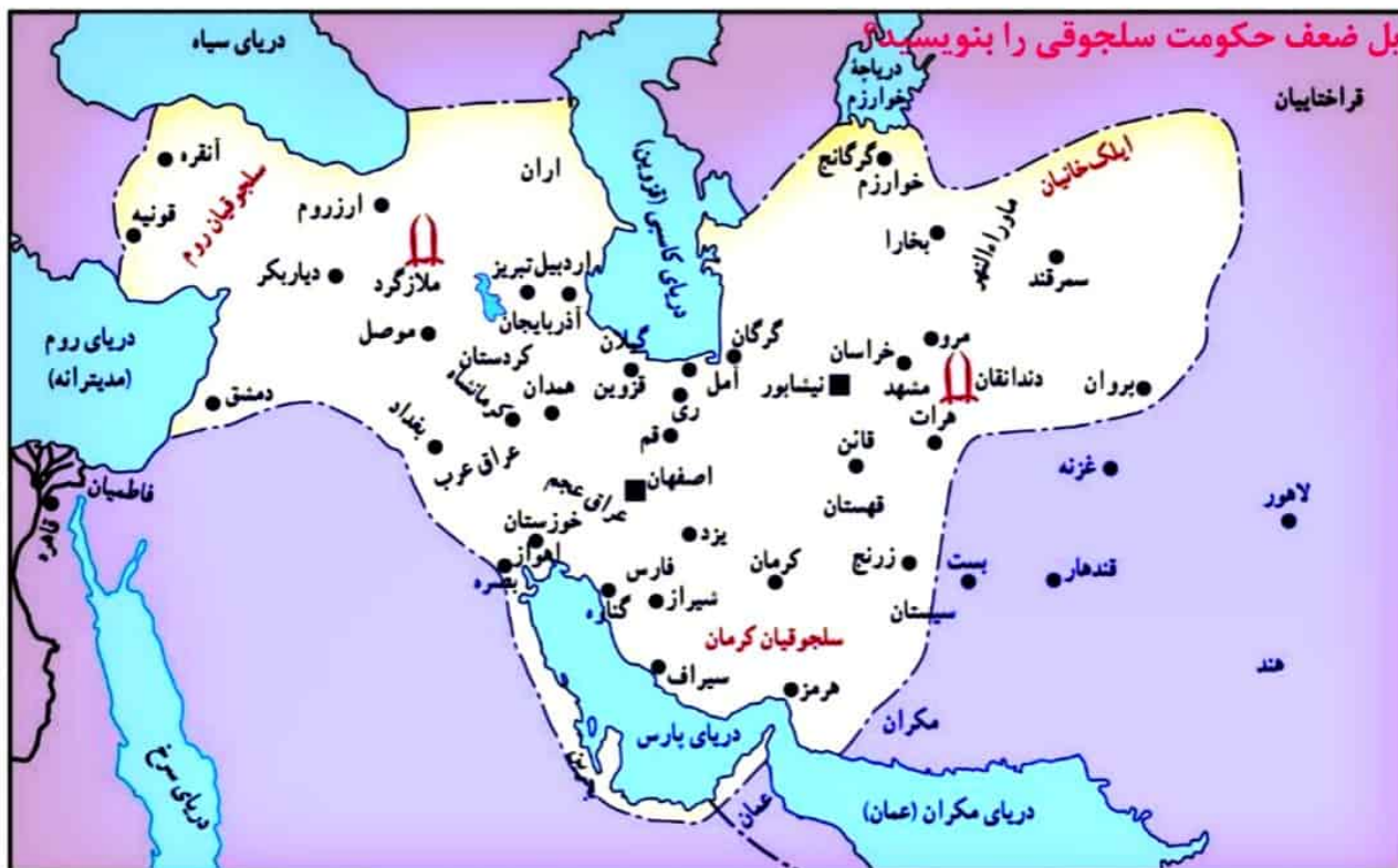
قلمرو سلجوقیان در زمان ملکشاه