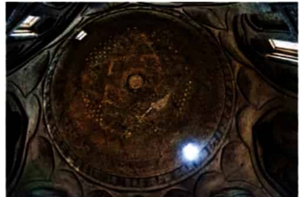
نمای داخلی گنبد مسجد جمعه اصفهان، دوره سلجوقیان

هنر کاشی‌کاری نیز در کنار توسعه معماری، در این دوره به اوج خود رسید و استفاده از نقوش انسانی، گیاهی، جانوری و نیز نقوش هندسی برای تزیین بناهای مذهبی و غیر مذهبی کاربرد فراوانی یافت.