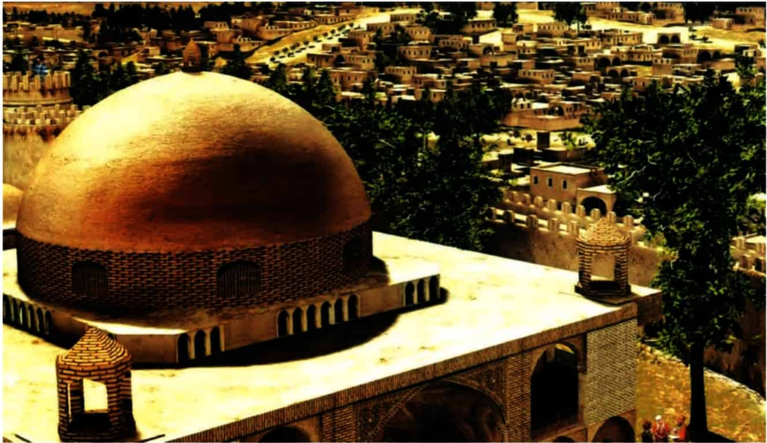
بخشی از شهر نیشابور در دوره سلجوقی که با استفاده از تصاویر ماهواره ای به صورت نگاشتناری (گرافیکی) بازسازی شده است ( هفت رخ فرخ ایران، ص ۱۴۴)