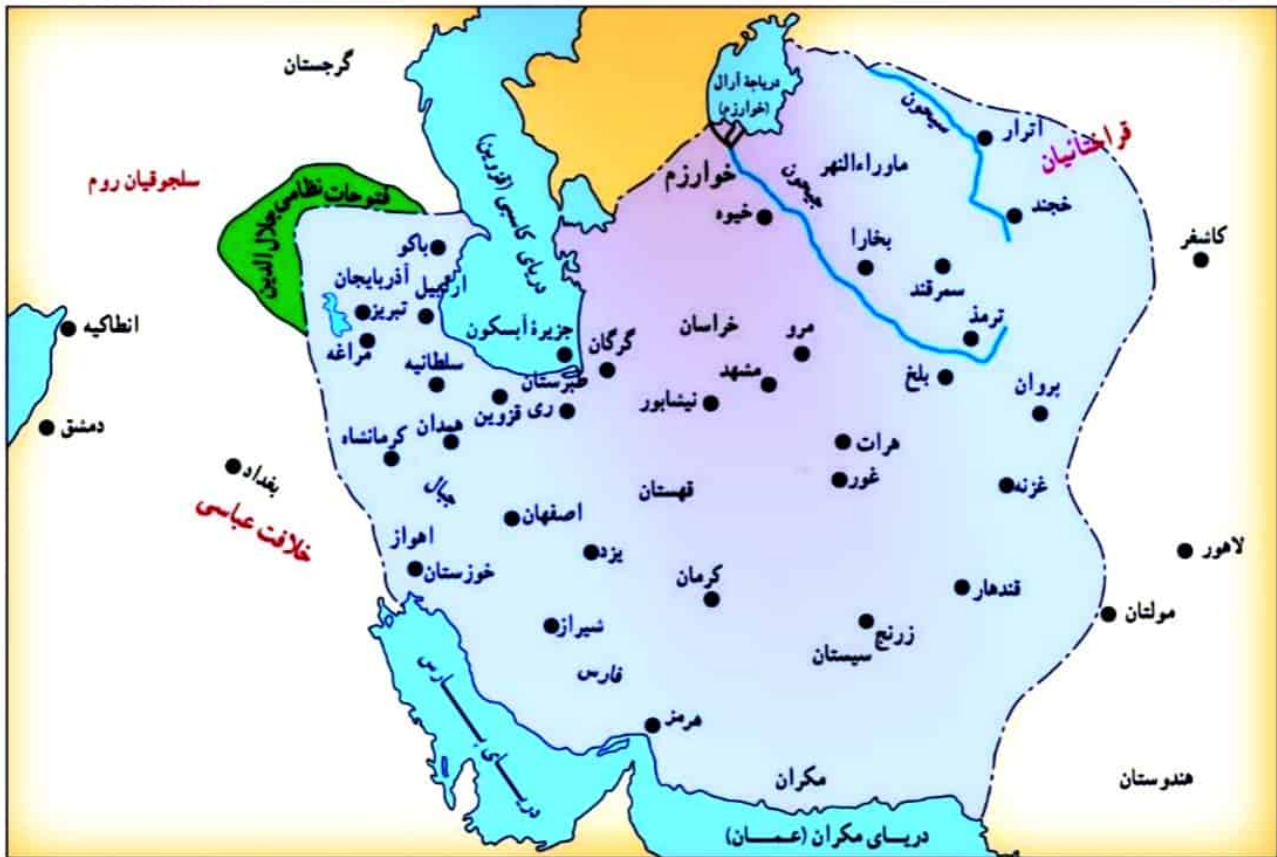
قلمرو خوارزمشاهیان در زمان سلطان محمد خوارزمشاه

بربخش وسیعی از ایران تسلط یافت. سلطان محمد خوارزمشاه نیز توسعه طلبی را وجهه همت خود قرار داد و با تسلط بر مناطق جدیدی، قلمرو خوارزمشاهیان را گسترش داد. (۱۲) در زمان سلطان محمد، روابط خوارزمشاهیان با خلافت عباسی، به تیرگی گرایید. خلیفه عباسی که در آن زمان درصدد احیای قدرت سیاسی و نظامی خود بود، از تأیید حکومت خوارزمشاهیان