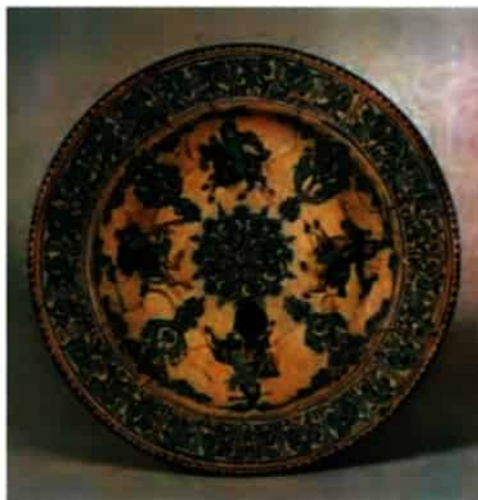
ظروف دوره سلجوقیان

فلزکاری در عصر سلجوقی یکی از درخشان‌ترین دوران خود را در تاریخ ایران پشت سر گذاشت. آثار فلزی با تزیینات فراوان به صورت قلم‌زنی و قالب‌ریزی در مقیاس فراوان تولید و گاهی اوقات به خارج از قلمرو سلجوقی صادر می‌شدند. شیوه‌های تولید و تزیین فلزکاری عصر سلجوقی به دلیل غنای خود بعداً به سرزمین‌های غرب قلمرو اسلامی انتقال یافت.