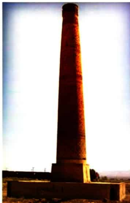
میل (منارة) خسرو گرد - سبزوار