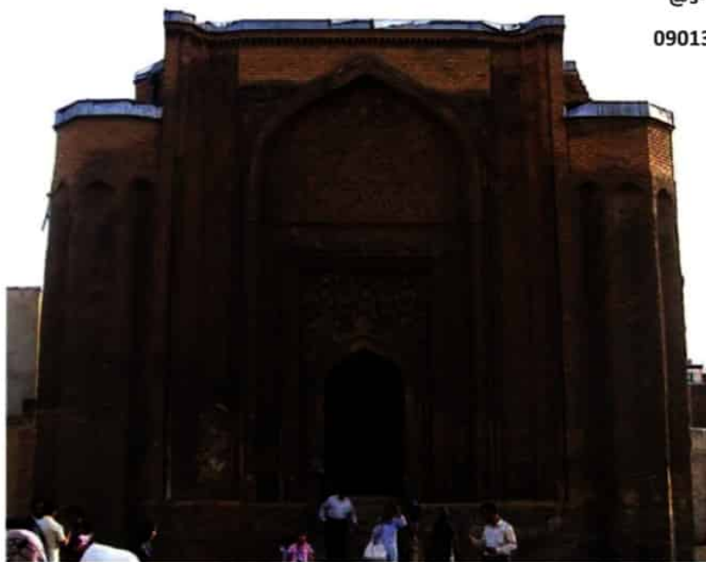
گنبد علویان از بناهای دوره سلجوقی - همدان