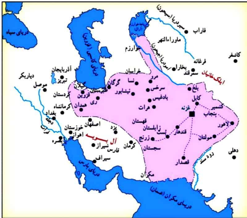
قلمرو غزنویان در زمان سلطان محمود

از جمله حوادث مهم دوران حکومت محمود غزنوی، لشکرکشی‌های بی‌دری‌وی به هند بود. او به بهانه جهاد در راه خدا بارها به هند حمله کرد؛ در حالی که هدف و انگیزه‌اش از این حملات، دستیابی به ثروت فراوان هند از طریق غارت معابد و پرستشگاه‌های آن سرزمین بود. در نتیجه این حملات، دین اسلام و زبان فارسی به شبه‌قاره هند راه یافت و گسترش پیدا کرد (۱ پرسش