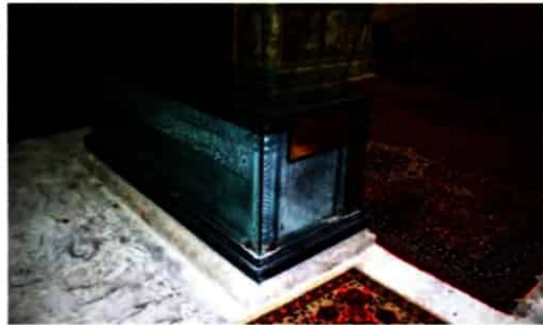
سنگ قبر منسوب به شاه عباس اول - آرامگاه حبیب بن موسی - کاشان

۳- توسعه اقتصادی، اجتماعی و فرهنگی ۱۷ ؛ شاه عباس اول به منظور بهبود وضع مردم و رفاه و آسایش عمومی، اصلاحات زیادی انجام داد. انجام کارهای عمرانی بزرگ مانند ایجاد کارگاه‌های بافندگی، جاده‌سازی و ساخت بناهای مختلف از قبیل پل‌ها، مسجدها، کاروان‌سراها، مدرسه‌ها، سدها و قنات‌ها، گسترش مناسبات اقتصادی با کشورهای اروپایی و همسایگان و توسعه تجارت خارجی از جمله این اقدامات بودند. ۱۷