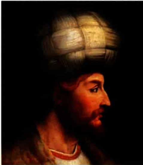
شاه اسماعیل اول

۵) در آغاز سده دهم هجری، اوضاع سیاسی میهن ما دچار آشفتگی و تفرقه زیاد شده بود. سلسله آق‌قویونلو که بر قسمت‌هایی از غرب و جنوب ایران حکومت می‌کرد، به نهایت ضعف و انحطاط رسیده بود. در چنین شرایطی اسماعیل، پسر شیخ حیدر، با سپاهی متشکل از ایلات و طوایف مختلف قزلباش، آق‌قویونلوها را شکست داد و پس از تصرف تبریز، در آن شهر به عنوان پادشاه ایران تاج‌گذاری کرد (۹۰۷ق.).