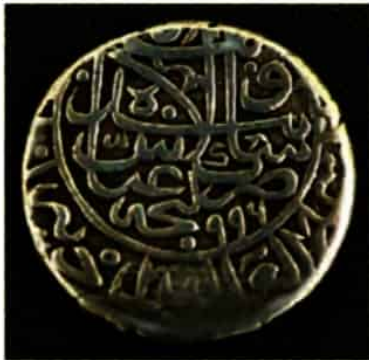
سکه ضرب شده به نام شاه عباس اول

۴- انتقال پایتخت از قزوین به اصفهان ۱۸ ؛ شاه عباس اول به دلایل سیاسی، نظامی و اقتصادی، پایتخت را از قزوین به اصفهان منتقل کرد و با استفاده از اصول مهندسی و شهرسازی، این شهر را به یکی از زیباترین و آبادترین شهرهای جهان تبدیل کرد. افزون بر این، وی گروهی از ارامنه را در اصفهان مستقر کرد و از دانش‌ها و تجارب فنی، اقتصادی و تجاری آنها به نفع کشور بهره برد ۱۸