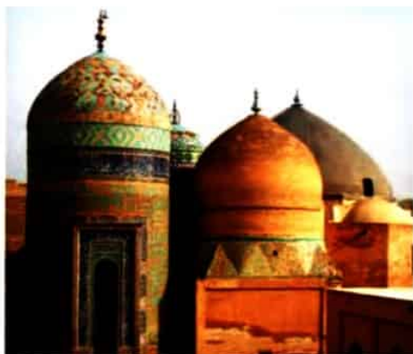
بقعه شیخ صفی‌الدین اردبیلی - اردبیل مشایخ طریقت صفوی از آغاز تا تشکیل حکومت