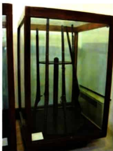
نمونه ای از سلاح های دوره صفوی

۱- ایجاد ثبات سیاسی و برقراری نظم و امنیت در داخل کشور: او برای تحقق این هدف، امرای سرکش و طغیانگر قزلباش را سرکوب کرد و قدرت سیاسی و نظامی آنان را به طور چشمگیری کاهش داد. ۲- نوسازی تشکیلات و تجهیزات سپاه: تا زمان شاه عباس اول، سپاه صفوی متشکل از جنگاوران ایلات مختلف (قزلباشان) بود و سران ایلات به اتکای نیروهای ایل خود هر گاه فرصت می یافتند، سرکشی و خودسری می کردند. (۱۶) شاه عباس