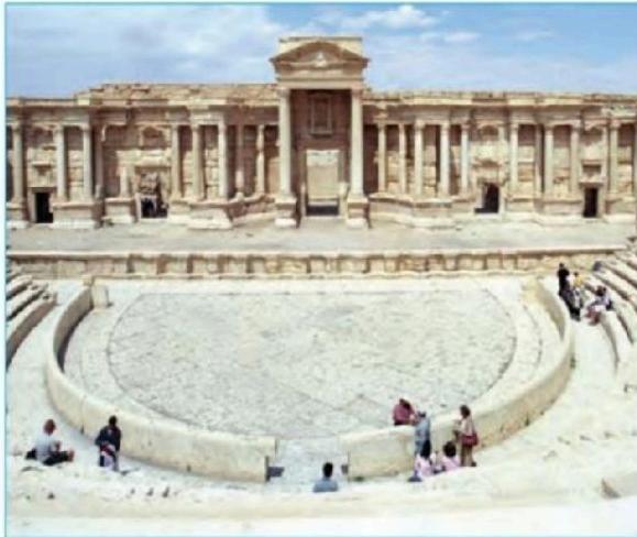
آثار باستانی تدمر (پالمیرا) پیش از تخریب توسط گروه داعش

در جریان فتوحات، مسلمانان هنگامی که به سپاه دشمن برخورد می‌کردند و یا به آبادی و شهری می‌رسیدند، طبق تعالیم اسلام و سنت پیامبر، سه پیشنهاد به آنان ارائه می‌دادند: اول، اسلام بیاورید؛ دوم، تسلیم شوید و جزیه پرداخت کنید و سوم، بجنگید. پذیرش هر یک از این پیشنهادها وضعیت متفاوتی را به وجود می‌آورد. اگر پیشنهاد اول پذیرفته می‌شد و طرف مقابل اسلام می‌آورد، آنان از حقوقی برابر با دیگر مسلمانان برخوردار می‌شدند؛ اموال و دارایی‌هایشان محفوظ می‌ماند و همچون سایر پیروان اسلام ملزم بودند که زکات بپردازند. اگر پیشنهاد دوم را می‌پذیرفتند و راضی به پرداخت جزیه می‌شدند، مسلمانان نیز امنیت جان و مال آنان را تضمین می‌کردند و به آنان اجازه می‌دادند که بر دین خویش باقی بمانند و آداب و مناسک مذهبی خود را به جا آورند. همچنین امنیت و احترام پرستگاه‌های آنها مانند کلیساها و آتشکده‌ها ضمانت می‌شد. البته پیشنهاد دوم فقط از پیروان کتاب‌های آسمانی مانند یهودیان، مسیحیان و زرتشتیان پذیرفته می‌شد که به آنان «اهل ذمه» می‌گفتند. در صورتی که کار به جنگ می‌کشید، نتیجه جنگ، تکلیف دو طرف را مشخص می‌کرد.