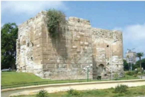
بقایای بخشی از باروی اسکندریه

۲۴- آثار و پیامدهای فتوحات در دوره خلفای نخستین را بنویسید؟