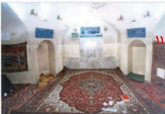
منزل منسوب به امام علی رضی الله عنه در کوفه

معدودی از بزرگان قریش مانند طلحه و زبیر نیز که بیعت کرده بودند، چون