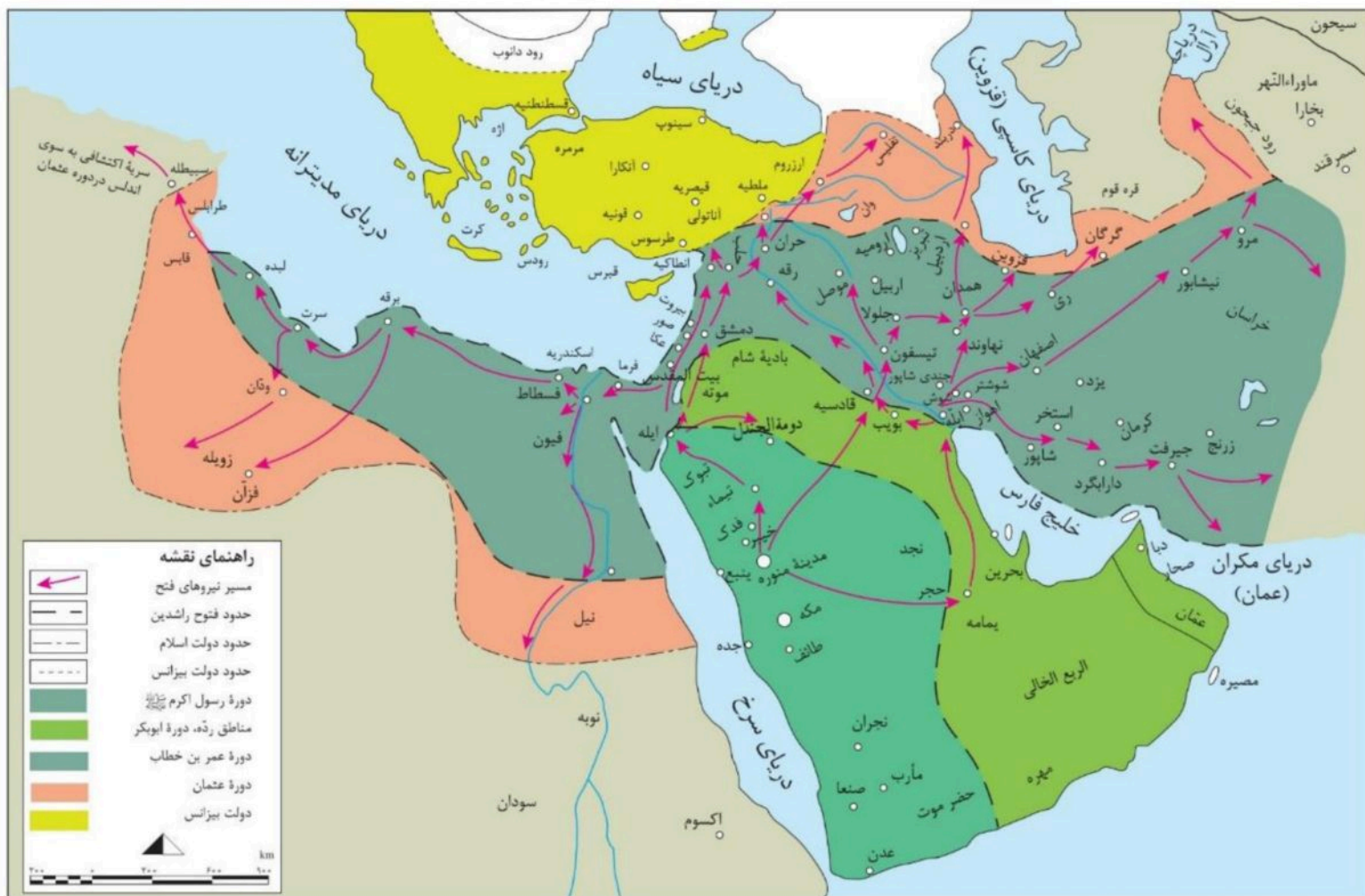
نقشه فتوحات در دوران خلفای نخستین

یکی از رویدادهای مهم تاریخ اسلام در دوران خلفای نخستین، لشکرکشی اعراب مسلمان به سرزمین‌های مجاور شبه‌جزیره عربستان بود. در نتیجه این لشکرکشی‌ها که از اواخر خلافت ابوبکر آغاز شد و تا پایان خلافت عثمان بدون وقفه ادامه یافت، سرزمین‌های ایران، شام و مصر فتح شد و اسلام به تدریج در آن سرزمین‌ها گسترش پیدا کرد.