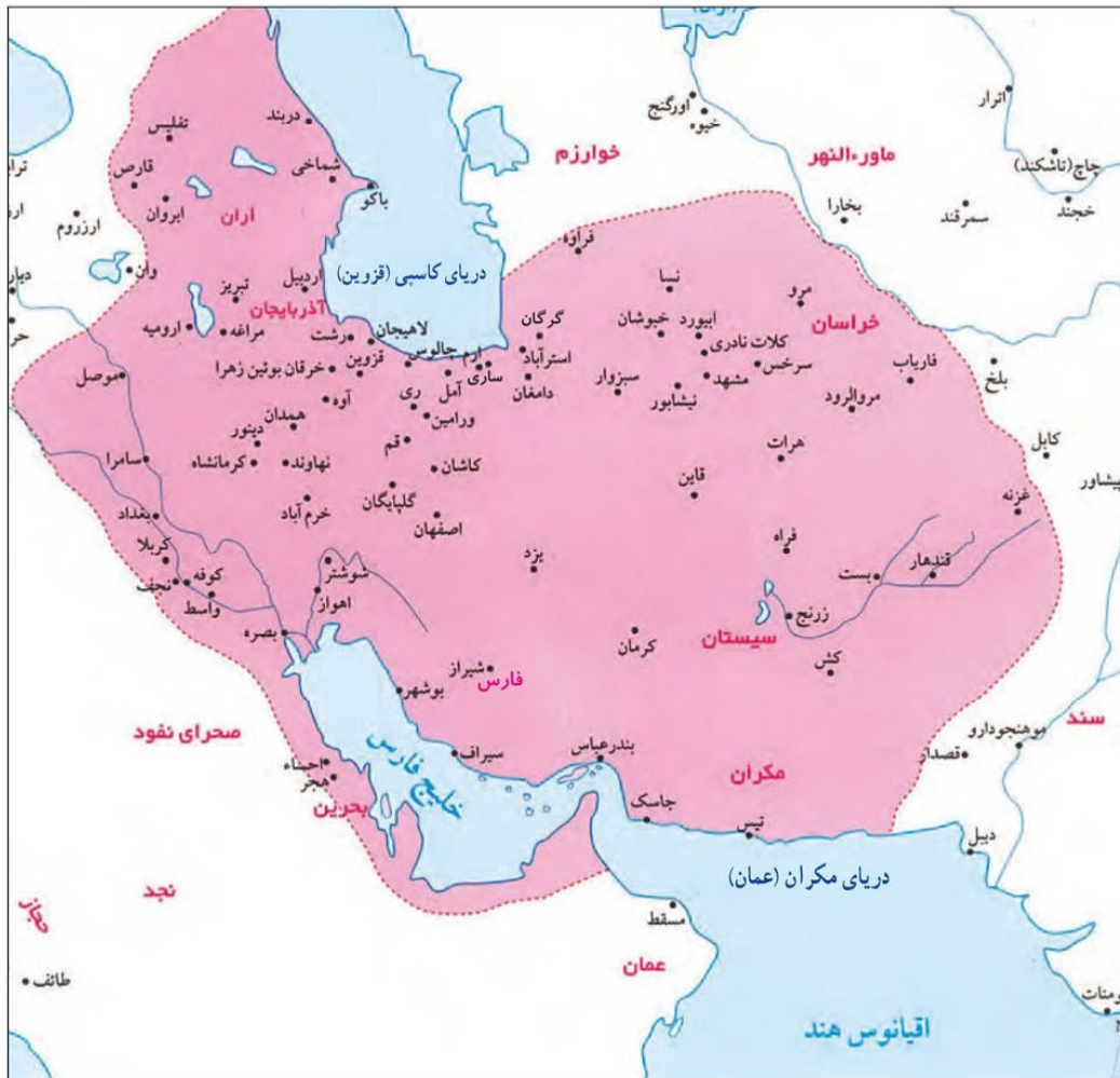
قلمرو حکومت صفوی در زمان شاه عباس اول

شاه عباس اول در ۴۲ سال زمامداری، با اقدامات خردمندانه و بهره‌گیری از مشاوران آگاه، ایران را به یکی از کانون‌های بزرگ سیاسی و اقتصادی جهان آن روز