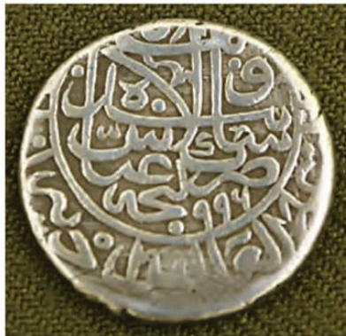
سکه ضرب شده به نام شاه عباس اول