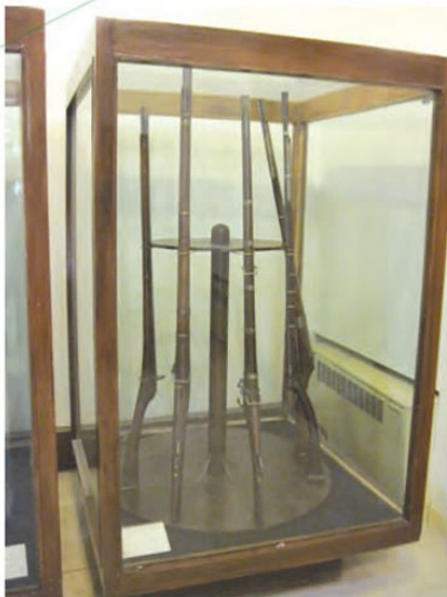
نمونه‌ای از سلاح‌های دوره صفوی