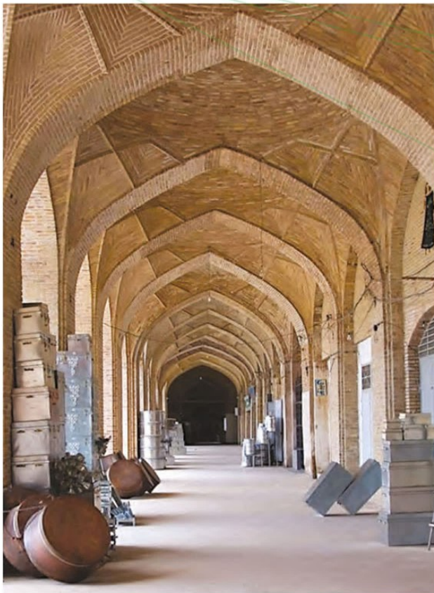
بازار گنجعلی‌خان کرمان از بناهای دوره صفوی

دولت برای اداره امور از کشاورزان و دامداران مالیات می‌گرفت. دامداران مالیات تحت عنوان «چوپان‌بیگی» می‌پرداختند. قلب اقتصاد شهری، بازار بود. گروه‌های مختلف اصناف و پیشه‌وران و صنعت‌گران در بازار فعالیت می‌کردند و کالاهای خود را در معرض فروش می‌گذاشتند و در قبال حفظ امنیت به دولت مالیات می‌پرداختند. بازارهای عصر صفوی از زنده‌ترین و زیباترین بازارهای جهان بود. در هر بازار راسته‌هایی وجود داشت و در هر یک، صنفی فعالیت می‌کرد، مثل راسته زرگرها، تفنگ‌سازها، آهن‌گران و کلاه‌دوزان. بازارهای اصفهان و کرمان از جمله شکوهمندترین بازارهای ایران بودند.