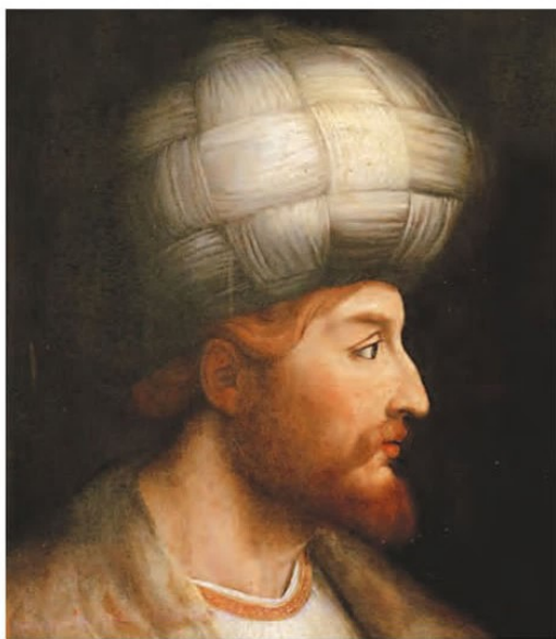
شاه اسماعیل اول

در آستانه تأسیس حکومت صفوی، حکومت مرکزی نیرومندی در ایران وجود نداشت و بر هر قسمت از کشور افراد و خاندان‌های مختلف که رقیب و دشمن یکدیگر بودند، حکومت می‌کردند. به نظر شما این وضعیت سیاسی چه تأثیری بر به قدرت رسیدن صفویان در ایران داشته است؟