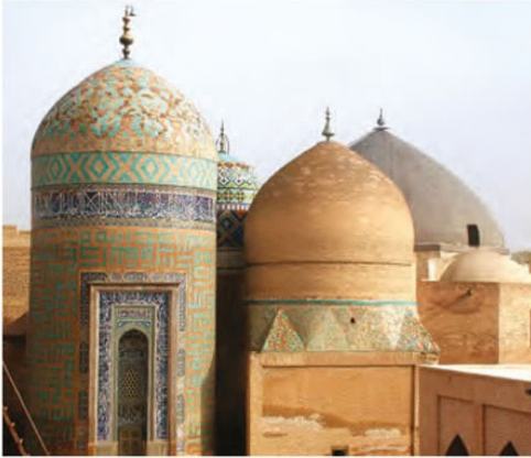
بقعه شیخ صفی‌الدین اردبیلی - اردبیل مشایخ طریقت صفوی از آغاز تا تشکیل حکومت