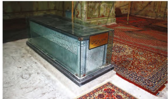
سنگ قبرمنسوب به شاه عباس اول - آرامگاه حبيب بن موسى - کاشان