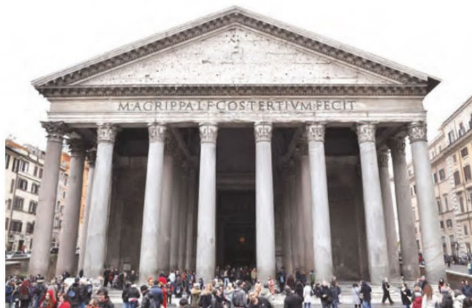
معبد پانتئون رم - از بناهای دوران روم باستان