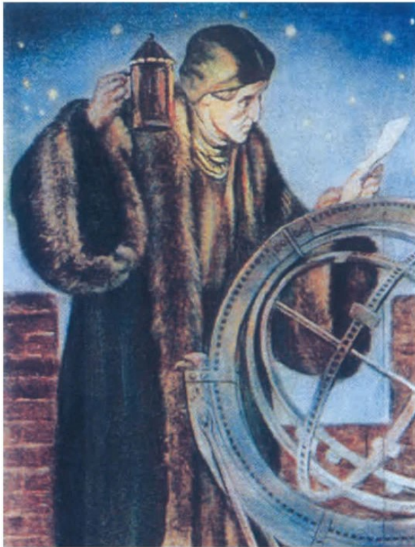
کوپرنیک در حال رصد ستارگان

۲۴- چه کسی در زمینه « کارکرد قلب » و گردش خون موفقیت های مهمی بدست آورد؟ جواب: (ویلیام هاروی)