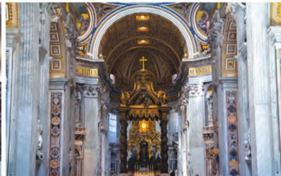
کلیسای سن پیترو در رم