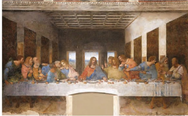
تابلوی «شام آخر» اثر داوینچی

عصر نوزایی، در معماری نیز شیوه نوینی به وجود آورد. معماران عصر رنسانس ساختمان‌های رم باستان را سرمشق خود قرار