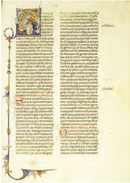
برگی از کتاب قانون ابن سینا که در قرن ۱۴ به زبان لاتین ترجمه شده است.