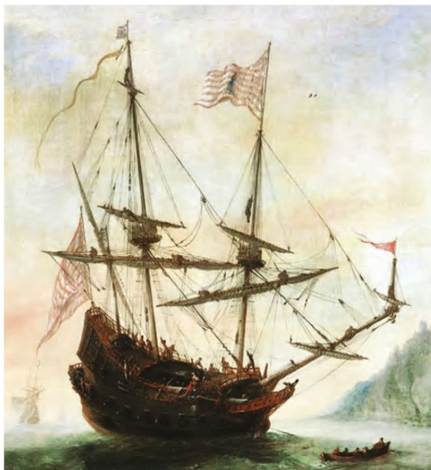
نمونه‌ای از کشتی‌های اروپایی در سده ۱۵ و ۱۶م

۲- افزایش اطلاعات جغرافیایی و توسعه مهارت دریانوردی اروپاییان در دوران پس از جنگ‌های صلیبی و اواخر قرون وسطا نیز تأثیر شایانی در کشف سرزمین‌ها و راه‌های جدید داشت. اروپاییان تا نیمه سده ۱۵م فنون نقشه‌کشی را تکامل بخشیدند و نقشه‌های نسبتاً دقیقی از دنیای شناخته شده آن روزگار طراحی و ترسیم کردند. به علاوه، اروپاییان در ساختن کشتی و بهره‌گیری از تجهیزات دریانوردی مانند قطب‌نما که چینی‌ها اختراع کرده بودند و اُسْطُرْلاب (وسیله‌ای که موقعیت اجرام آسمانی را معلوم می‌کرد)، به پیشرفت فوق‌العاده‌ای رسیدند.