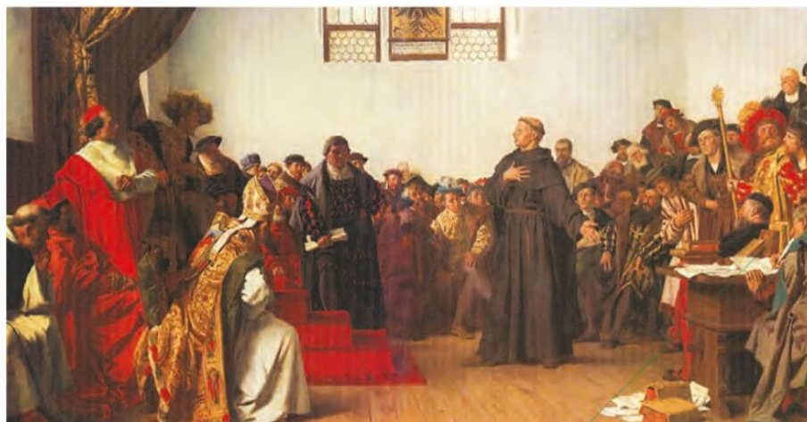
لوتر هنگام دفاع از خود در دادگاه امپراتوری مقدس روم