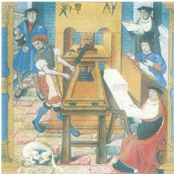
کارگاه چاپ اواخر قرن ۱۵م

در اواسط قرن شانزدهم نیکلاس کوپرنیک ۱ در رساله گردش اجرام سماوی، نظریه چرخش زمین به دور خورشید را مطرح کرد.