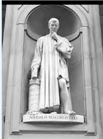
تندیس نیکولو ماکیاولی