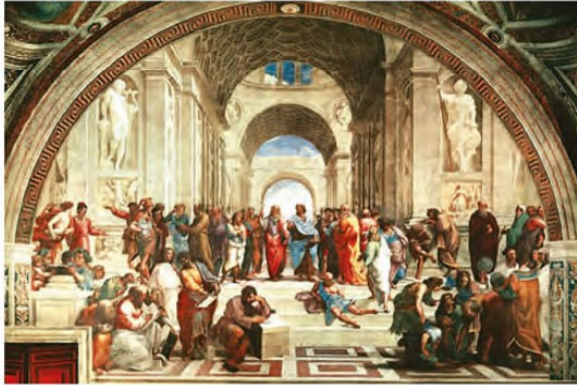
تابلوی «مدرسه آتن» اثر رافائل

۱۷ج نقاشی، مجسمه‌سازی و معماری سرآمد هنرمندان به شمار می‌رفت، در علوم مختلف از قبیل ریاضی، مهندسی و زمین‌شناسی نیز سررشته داشت. مشهورترین اثر نقاشی او شام آخر و مونالیزا ۴ یا لبخند ژکوند ۵ است. ۱۷ج