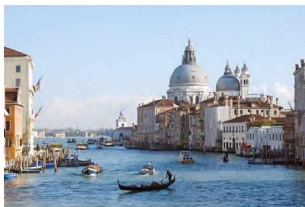
ونیز - ایتالیا