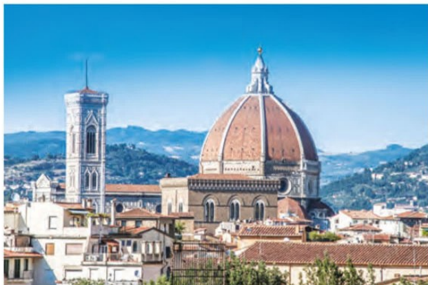
فلورانس ملکه شهرهای اروپا در عصر رنسانس

از سده ۱۱م به تدریج در اروپا شهرنشینی و تجارت، در پیوندی تنگاتنگ با یکدیگر، دوباره رونق گرفت. جنگ های صلیبی تأثیر فراوانی بر رشد شهرها و تجارت به ویژه در مناطق ساحلی اروپا گذاشت. تأثیر این جنگ ها بر رونق و شکوفایی شهرها در ایتالیا بیش از سایر سرزمین های اروپایی بود. شهرهای ایتالیایی در آن زمان، سرآمد شهرهای اروپا در تجارت، بانکداری و صنعت به شمار می رفتند. شهرهای بندری ونیز ۱ ، جنوا ۲ ، پیزا ۳ و پالمو ۴ تجارت در دریای مدیترانه و سواحل غربی اروپا را در اختیار داشتند. فلورانس ۵ ، مرکز داد و ستد کالاهای قیمتی فلزی و چرمی بود و تجارت پارچه را در بخش وسیعی از اروپا به خود اختصاص داده بود.