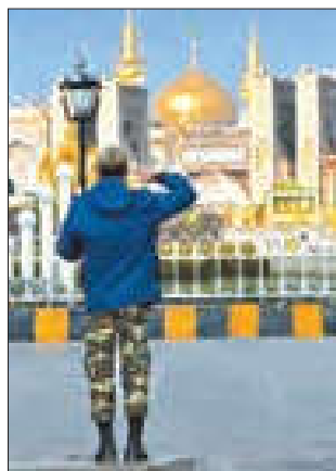
انسان ها در انجام کنش به معنای آن توجه دارند.