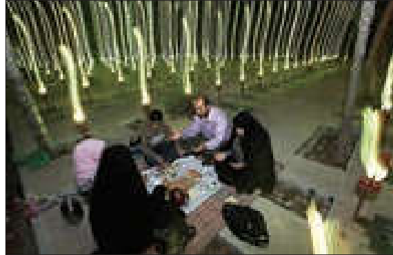
■ افطار کنار مزار شهدا، کنش ناظر به دیگران

توضیح: هر چیزی که انسانها بوجود آورده اند پدیده اجتماعی است