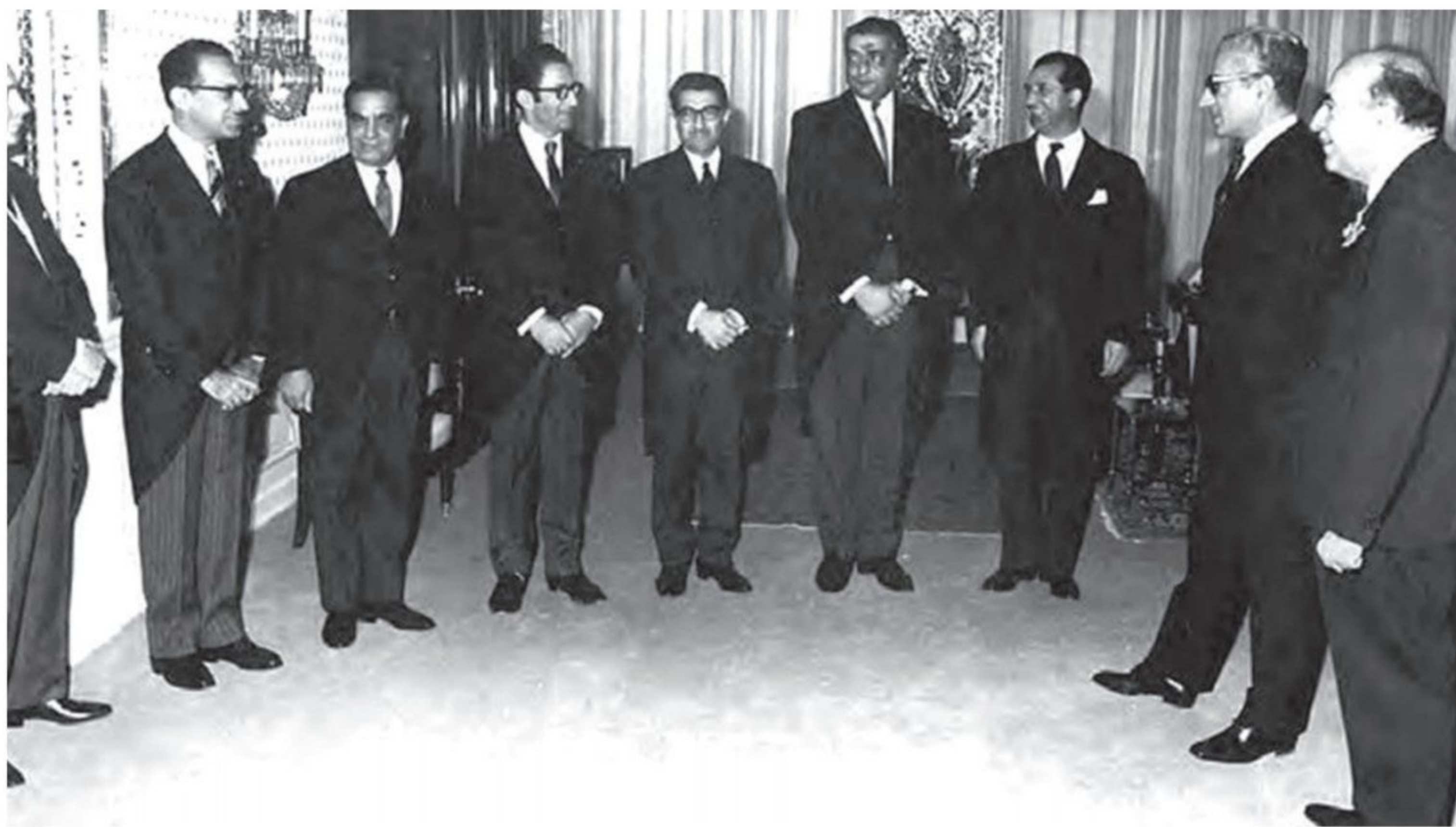
امیرعباس هویدا هنگام معرفی اعضای کابینه خود به شاه

پس از تبعید امام خمینی و سرکوب شدید مخالفان، اوضاع سیاسی آرام تر شد 1 (همچنین با افزایش چشمگیر درآمدهای نفتی ایران در دوران طولانی نخست وزیری امیرعباس هویدا، حکومت پهلوی برای تقویت و تحکیم پایه های اقتدار خود به اقداماتی نمایشی دست زد) 1 برگزاری جشن تاج گذاری و جشن های دوهزار و پانصد ساله شاهنشاهی، منحل کردن احزاب موجود و ایجاد حزبی واحد به نام حزب رستاخیز از جمله این اقدامات بود 2 با این حال وضعیت زندگی و معیشت عموم مردم که بیشتر در روستاها زندگی می کردند، مناسب نبود و در بیشتر نقاط ایران روستائین ها در فقر و بی سوادى به سر می بردند. 3 در زمینه فرهنگی نیز رژیم پهلوی کوشید میان فرهنگ ایرانی و فرهنگ اسلامی تقابلی مصنوعی ایجاد کند. پیرو همین سیاست 4 (به بهانه ناهمخوانی تاریخ هجری شمسی با فرهنگ ایرانی، تاریخ شاهنشاهی را جایگزین تقویم هجری شمسی کرد) 3