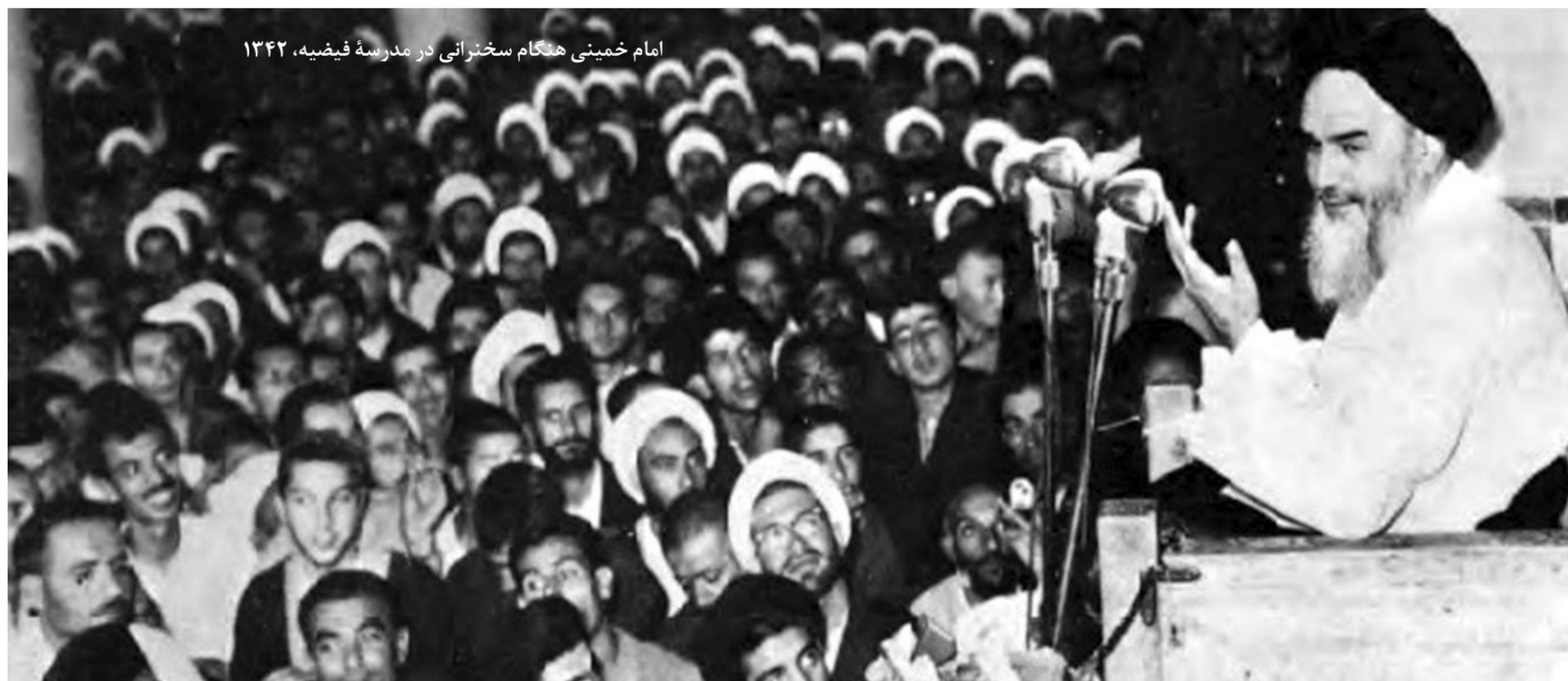
امام خمینی هنگام سخنرانی در مدرسه فیضیه، ۱۳۴۲

۱- اسناد لانه جاسوسی آمریکا، ۱۳۸۶، ج ۱، ص ۲۶۸