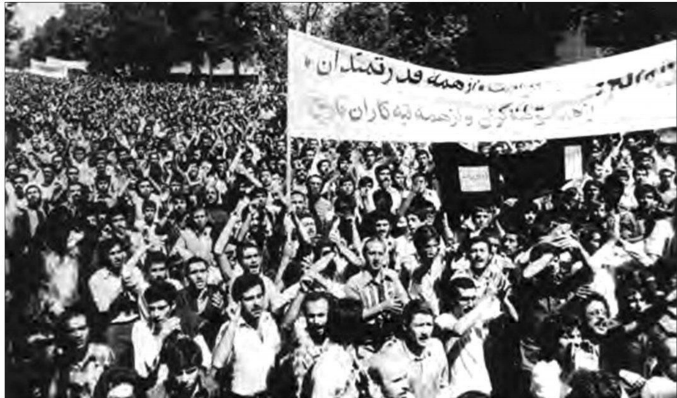
تظاهرات مردم تهران در شهریور ۱۳۵۷