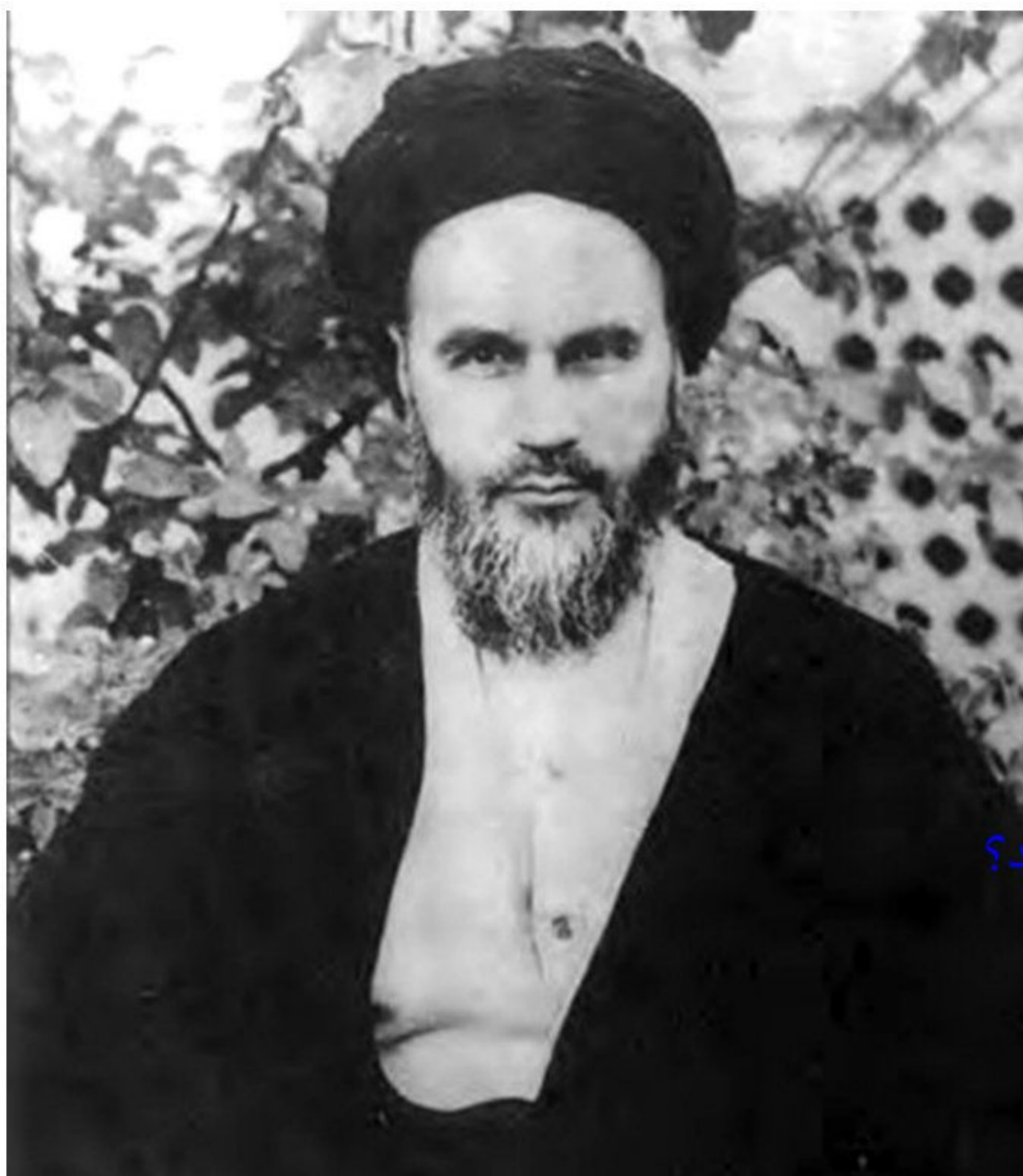
امام خمینی، رهبر نهضت اسلامی

9) پس از مطرح شدن انقلاب سفید و همه پرسى آن، امام خمینی و تعدادی از علما، نخست از شاه در این باره توضیح خواستند اما با بی اعتنایی و توهین او مواجه شدند. پس با انتشار اعلامیه ای همه پرسى فرمایشی را غیرقانونی اعلام کردند. بیشتر مراجع دینی نیز به دعوت امام خمینی همه پرسى را تحریم کردند. 9) (در تهران و قم تظاهرات گسترده ای برپا شد و رژیم پهلوی با استفاده از نیروی نظامی، قیام مردم تهران و قم را سرکوب کرد.) 10)