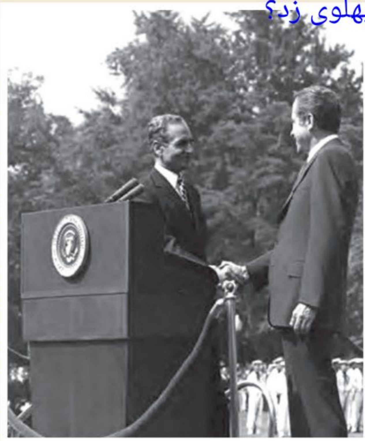
محمدرضا شاه پهلوی هنگام ملاقات با نیکسون رئیس جمهور آمریکا

پس از تبعید امام خمینی و سرکوب شدید مخالفان، اوضاع سیاسی آرام تر شد 1 (همچنین با افزایش چشمگیر درآمدهای نفتی ایران در دوران طولانی نخست وزیری امیرعباس هویدا، حکومت پهلوی برای تقویت و تحکیم پایه های اقتدار خود به اقداماتی نمایشی دست زد) 1 برگزاری جشن تاج گذاری و جشن های دوهزار و پانصد ساله شاهنشاهی، منحل کردن احزاب موجود و ایجاد حزبی واحد به نام حزب رستاخیز از جمله این اقدامات بود 2 با این حال وضعیت زندگی و معیشت عموم مردم که بیشتر در روستاها زندگی می کردند، مناسب نبود و در بیشتر نقاط ایران روستائین ها در فقر و بی سوادى به سر می بردند. 3 در زمینه فرهنگی نیز رژیم پهلوی کوشید میان فرهنگ ایرانی و فرهنگ اسلامی تقابلی مصنوعی ایجاد کند. پیرو همین سیاست 4 (به بهانه ناهمخوانی تاریخ هجری شمسی با فرهنگ ایرانی، تاریخ شاهنشاهی را جایگزین تقویم هجری شمسی کرد) 3