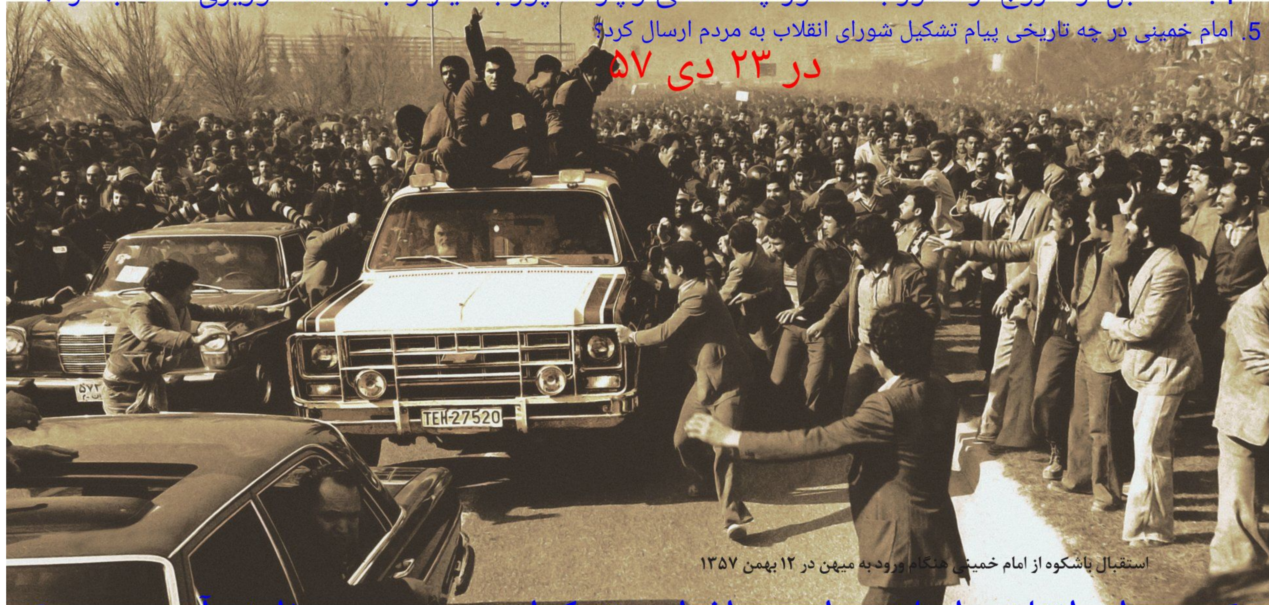
استقبال پاشکوه از امام خمینی هنگام ورود به میهن در ۱۲ بهمن ۱۳۵۷

5. امام خمینی در چه تاریخی پیام تشکیل شورای انقلاب به مردم ارسال کرد؟ در ۲۳ دی ۵۷