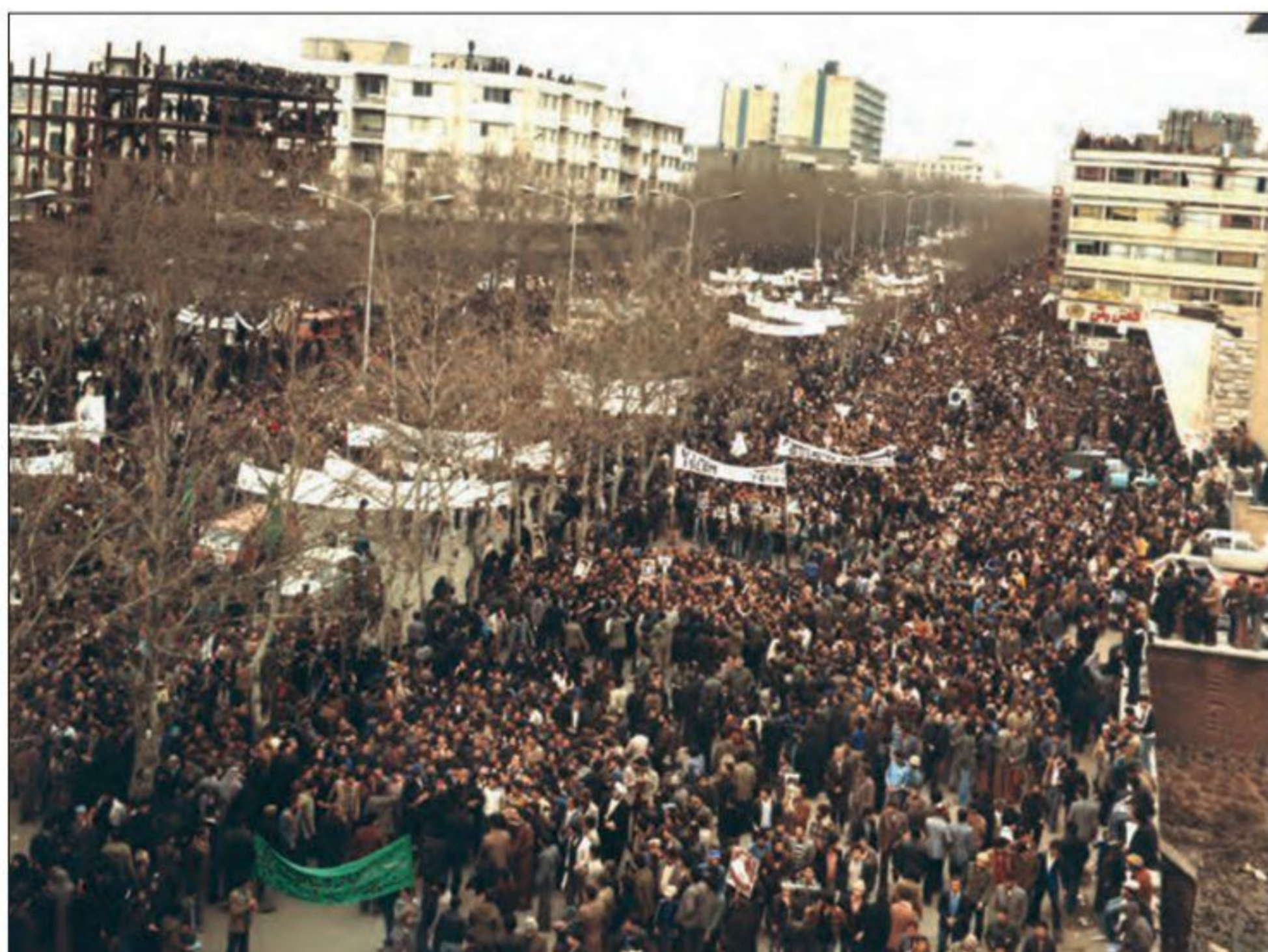
راه پیمایی میلیونی مردم تهران در تاسوعای حسینی، ۱۹ آذر ۱۳۵۷

4 4 حماسه ماه محرم (شاه پس از سرکوب تظاهرات دانشجویان و دانش آموزان در مقابل دانشگاه تهران (۱۳ آبان)، ارتشبد غلامرضا ازهاری را جانشین شریف امامی کرد تا وی با برقرار کردن حکومت نظامی از سرعت حرکت انقلاب بکاهد). 4 اما شروع ماه محرم، مبارزه را وارد مرحله تازه ای کرد. در روزهای تاسوعا و عاشورا میلیون ها تن از مردم در شهرهای مختلف، از جمله تهران، با شرکت در تظاهراتی مسالمت آمیز سقوط حکومت پهلوی و برقراری حکومت اسلامی را فریاد زدند.