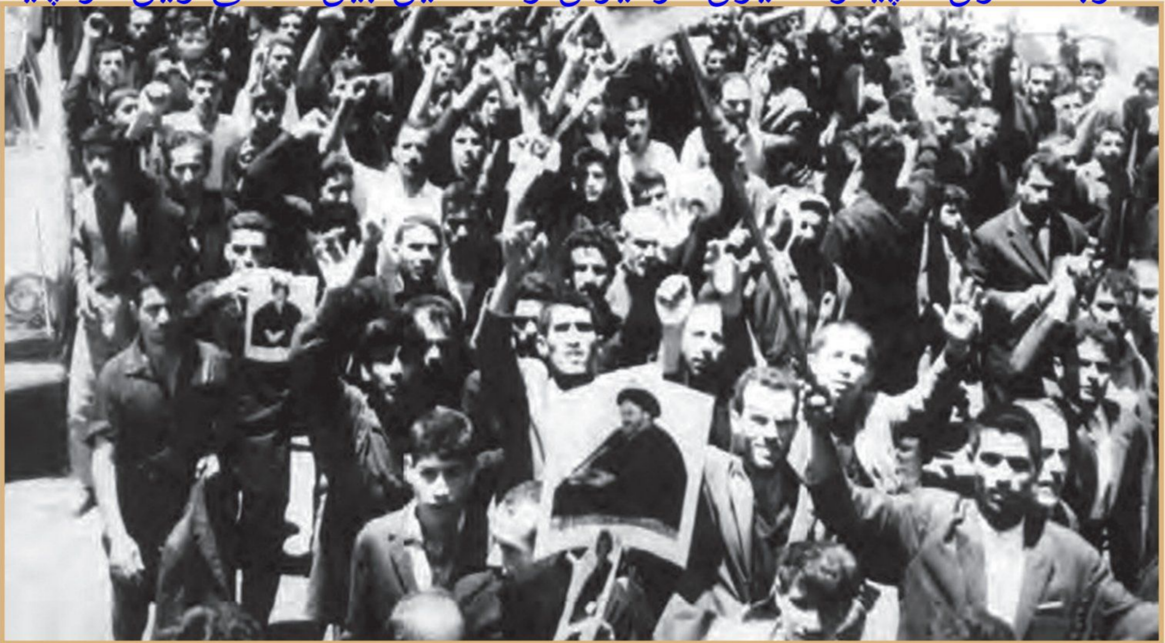
نمایی از تظاهرات مردم تهران در ۱۵ خرداد ۱۳۴۲