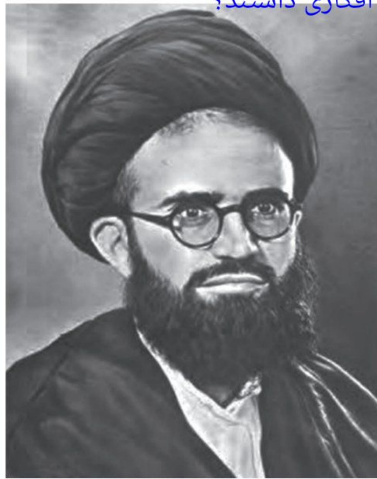
شهید آیت الله سعیدی (۱۳۰۸-۱۳۴۹ ش)

7. سازمان چریک های فدایی خلق از همان آغاز چه افکاری داشتند؟