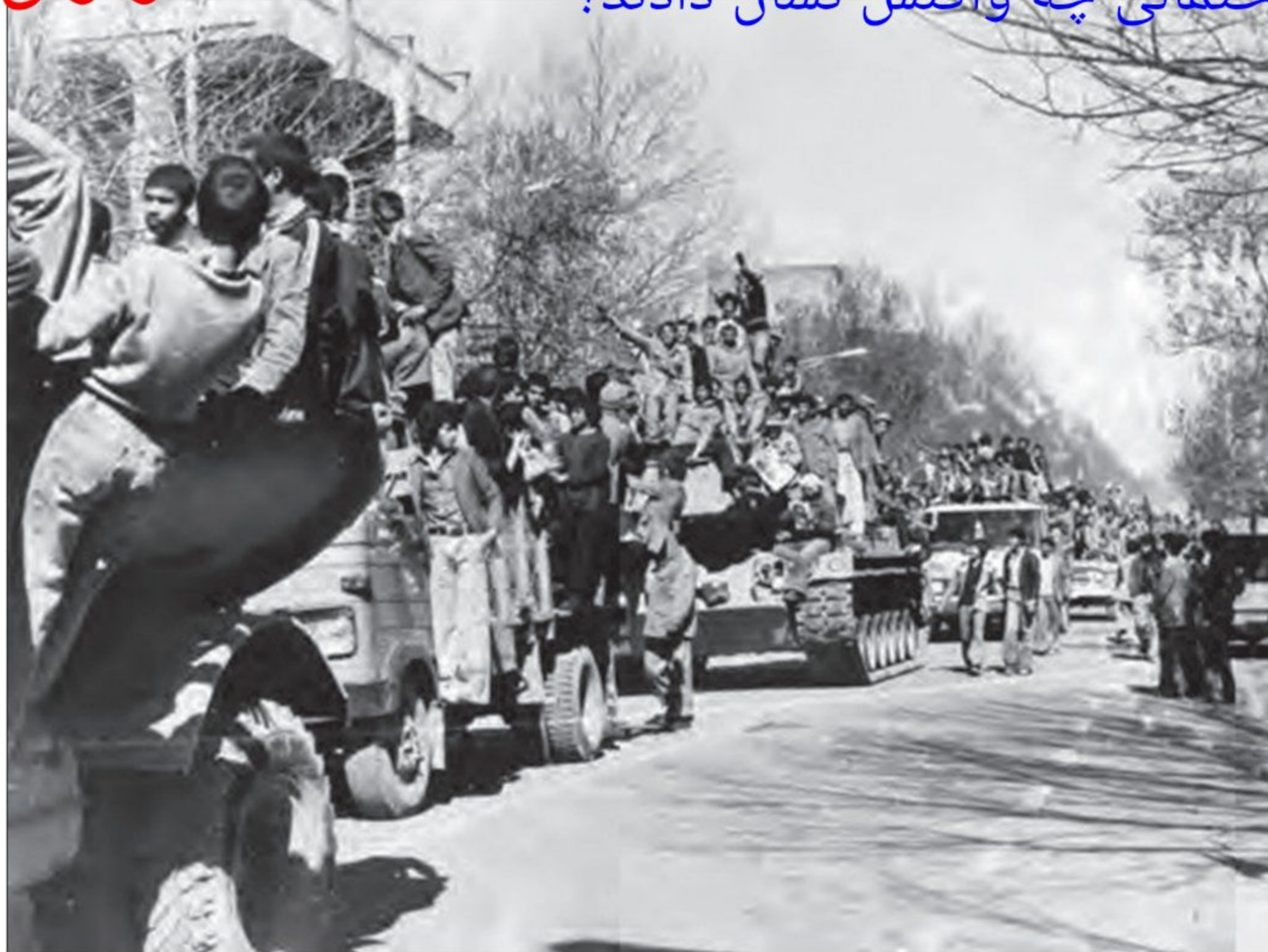
تهران - ۲۲ بهمن ۱۳۵۷