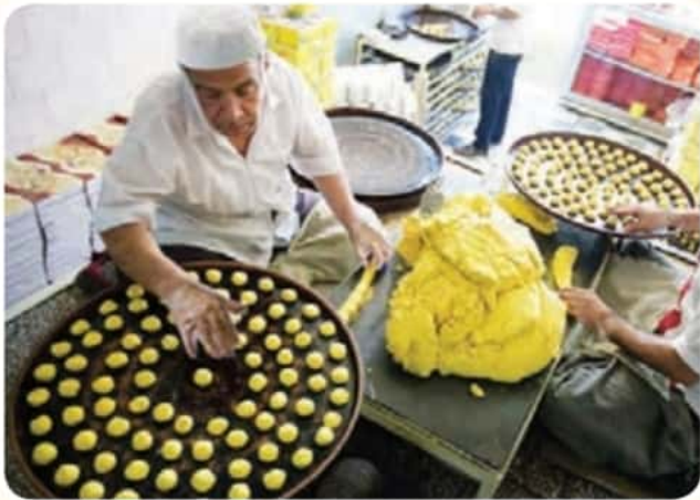
تهیه و بخت نان برنجی