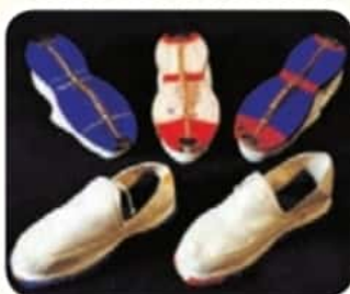
کلاش (گیوهی کرمانشاهی)