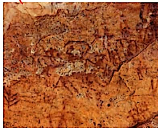
تصویر نقاشی بر روی صخره، میرماس، کوه‌دشت استان لرستان، ایران