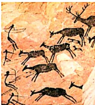
تصویر نقاشی از داخل غار لاسکو در فرانسه، غذای معتقدند که این نقاشی‌ها مربوط به ۱۳۰۰۰ سال پیش است.

۴ (نقاشی‌های به جا مانده روی دیوار غارهای قدیمی یا تخته سنگ‌ها نشان می‌دهد که شکار در تأمین غذای انسان‌ها در آن دوره نقش مهمی داشته است.)