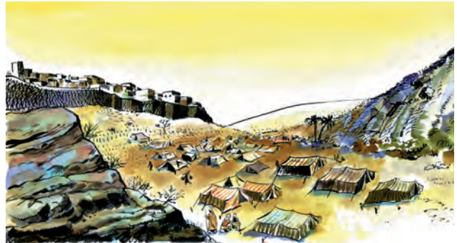
▲ تصویر شعب ابی طالب در زمان محاصره

مادر در حالی که عکسی را به بچه‌ها نشان می‌داد، خندید و گفت: «اتفاقاً هتل ما در نزدیکی شعب ابی طالب بود.» مادر ادامه داد: «پس از چندی کافران با هم پیمان بستند که رابطه‌ی خود را با مسلمانان قطع کنند و با آنها خرید و فروش و ازدواج نکنند. آنها همچنین عهدنامه‌ای نوشتند و آن را در خانه‌ی کعبه گذاشتند. پیامبر و یارانش سه سال در آن درّه زندگی می‌کردند. پس از این مدت (روزی پیامبر از جانب خدا آگاه شد که موریانه عهدنامه‌ی کافران را خورده است. ج ۱۴) ابو طالب (ع) عموی پیامبر ، این خبر را به کافران داد و از آنان خواست که عهدنامه را بیاورند. همچنین گفت: «اگر محمد (ص) در مورد عهدنامه درست نگفته باشد، او را به شما تسلیم خواهیم کرد». کافران رفتند و دیدند که پیامبر (ص) درست گفته است؛ بنابراین، به پیامبر و مسلمانان اجازه دادند که دوباره به مکه بازگردند» در این هنگام، مادر بزرگ سارا گفت: «شام حاضر است. بچه‌ها، کمک کنید سفره را آماده کنیم. صلواتی بفرستید و بیایید». پدر و عمو با صدای بلند صلوات فرستادند.