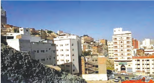
▲ شعب ابی طالب در حال حاضر

سارا گفت: «ما در کتاب هدیه‌های آسمان خواندیم که پیامبر و یارانش مجبور شدند به یکی از درّه‌های اطراف مکه به نام شعب ابی طالب بروند و سه سال در آنجا در کمال سختی زندگی کنند».