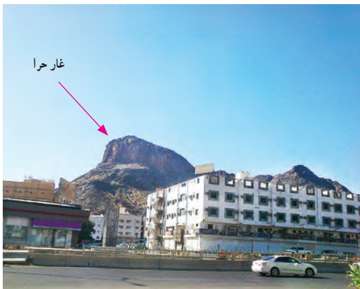
منظره‌ی غار حرا در اطراف شهر مکه

مادر سارا گفت: « بچه‌ها! غار حرا نیز در نزدیکی شهر مکه قرار دارد و از مکان‌های مقدّس است » پیامبر گرامی اسلام (حضرت محمد (ص))، برای راز و نیاز با خدا به این غار می‌رفت. در همین غار بود که از طرف خداوند به پیامبری مبعوث شد. ج ۸