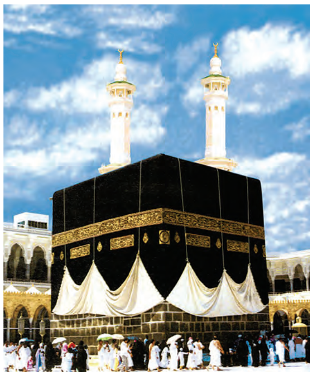
۸ خانه ی کعبه — مسجد الحرام

پدر پاسخ داد: «بله. ما به کشور عربستان رفتیم. در فرودگاه جده پیاده شدیم و به سمت مکه، حرکت کردیم. تمام راه بیابان بود. (مکه و مدینه، مهم ترین شهرهای مقدس مسلمانان جهان، در کشور عربستان قرار دارند)» ج ۱