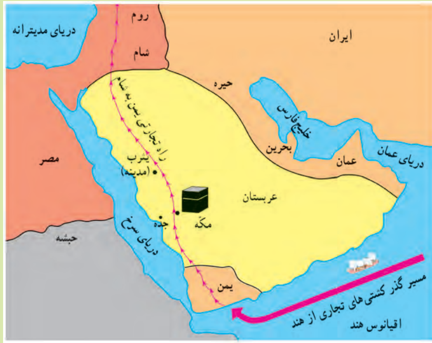
نقشه ی شماره ی ۱

ج ۵) به سرزمینی که از سه طرف به آب و از یک طرف به خشکی راه داشته باشد، شبه جزیره می گویند. ج ۶) در زمان ظهور اسلام، مهم ترین شهر عربستان مکه بود؛ زیرا این شهر بر سر راه کاروان های بازرگانی قرار داشت و خانه ی کعبه نیز در آن جا بود.