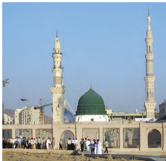
مسجد النبی، نمای بیرونی

زمان زیادی از شب گذشته بود اما بچه‌ها همچنان با اشتیاق به حرف‌های پدر و مادرشان گوش می‌دادند. مادر به آنها گفت: «بچه‌ها، خیلی از وقت خوابتان گذشته است». سارا گفت: «مادر! پدر! خوش به حالتان! چه سفر خوبی داشته‌اید! کاش روزی ما هم خانه‌ی خدا را زیارت کنیم».