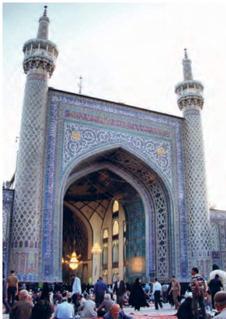
▲ مسجد گوهرشاد، مشهد

ج ۵) شاهرخ، پسر تیمور، برخلاف پدر خود مردی نیکوکار بود و سعی