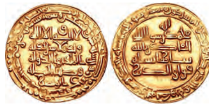
▲ سکه‌های دوره‌ی ایلخانان

است که به همت گوهرشاد، همسر شاهرخ، ساخته شد. ج ۶