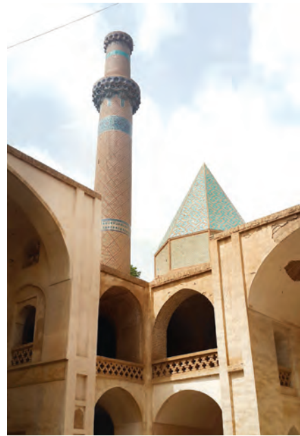
▲ مسجد جامع نطنز