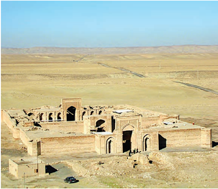
▲ کاروان‌سرای شرف در نزدیکی سرخس، استان خراسان رضوی

در زمان جانشینان چنگیز، هلاکو و تیمور، مردم ایران به تدریج، ویرانه‌ها را به شهرهایی آباد و پررونق تبدیل کردند و شهرنشینی را در ایران گسترش دادند. در این شهرها بناهای زیادی چون مساجد، کاروان‌سراها، حمام‌ها و برج‌ها ساخته شد.