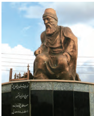
۸ خواجه رشیدالدین فضل‌الله همدانی