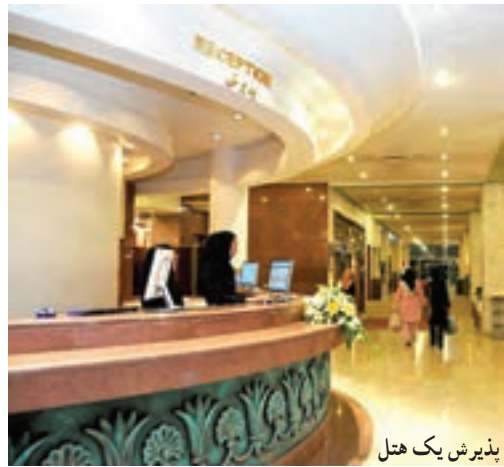
پذیرش یک هتل