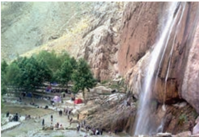
تنگه ریگان - سمیرم - اصفهان

۵- فرض کنید فصل تابستان است و عده زیادی مسافر به شهر یا روستای محل زندگی شما سفر کرده‌اند. شما برای کسب درآمد چه شغل‌هایی پیشنهاد می‌کنید؟ خود شما دوست دارید چه شغلی در این زمینه داشته باشید؟