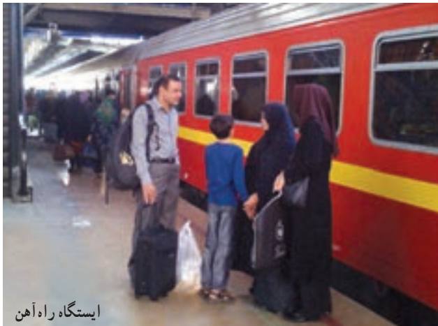
ایستگاه راه آهن