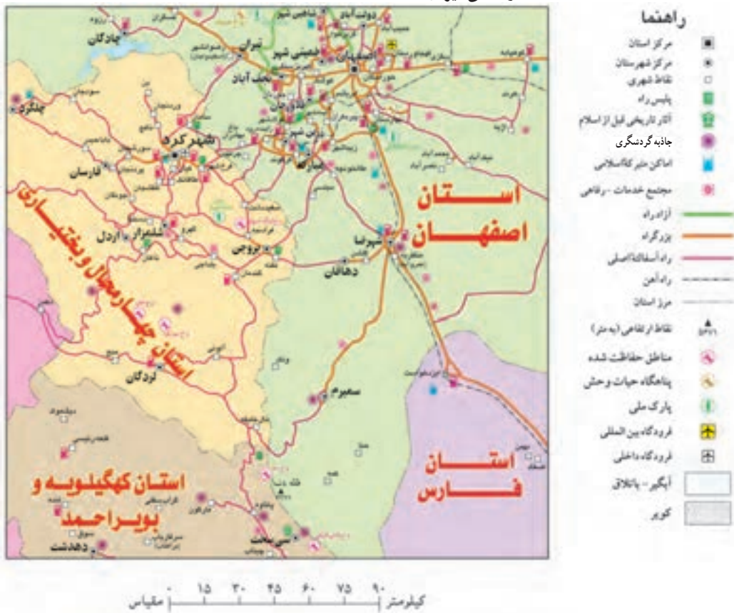
نقشه راه‌های ایران

بر روی نقشه راه‌ها، جاده‌های اصلی و فرعی و همچنین مکان‌های خدماتی چون رستوران‌ها، تعمیرگاه‌ها، پمپ بنزین‌ها، نمازخانه و نظایر آن مشخص شده است. با استفاده از مقیاس نقشه راه‌ها می‌توانید حساب کنید چقدر از روستا یا شهری که می‌خواهید به آن سفر کنید، فاصله دارید.