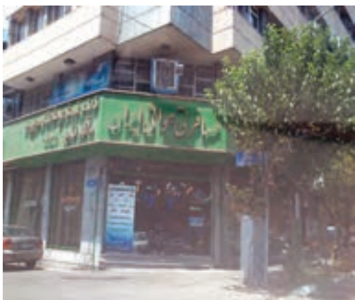
یک آژانس مسافرتی

بعضی از افراد برای بازدید از نمایشگاه‌ها یا حضور در گردهمایی‌های علمی سفر می‌کنند و بالاخره برخی از گردشگران هم به «طبیعت‌گردی*» می‌پردازند.