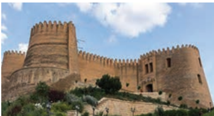
قلعه فلک الافلاک، خرم‌آباد، لرستان