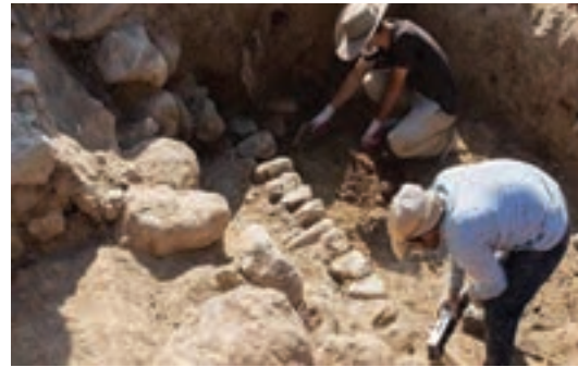
نحوه کار باستان‌شناسان