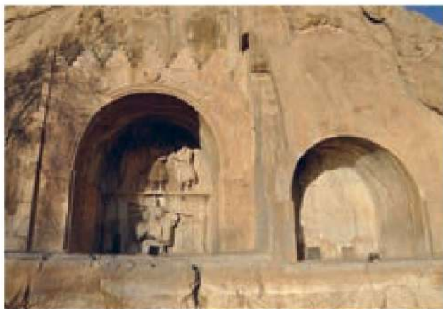
طاق بستان - کرمانشاه