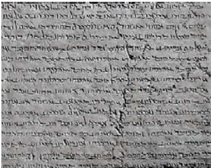
کتیبه به خط پهلوی