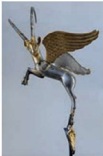
دسته گلدان بز طلایی

در طراحی و محاسبات هندسی تبحر داشته‌اند (شناخت فلزات، ذوب و استخراج فلزات، ریخته‌گری و قالب ریزی، طراحی و ذوق هنری، محاسبات هندسی، سفال‌گری)