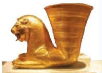
ریتون (تکوک) شیر غزان