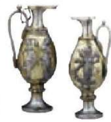
پارچ نقره و طلا