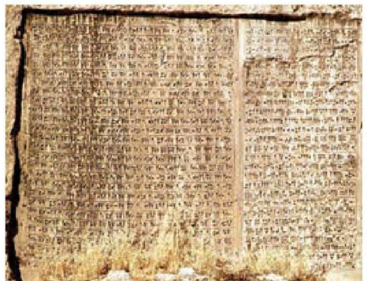
کتیبه به خط میخی