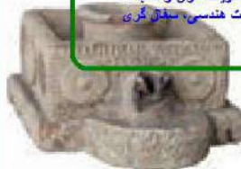
چراغ روغن سوز سرامیکی