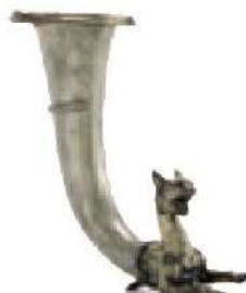
ریتون (تکوک) نقره‌ای