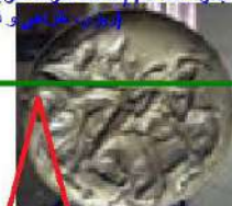
بشقاب نقره‌ای با روکش طلا