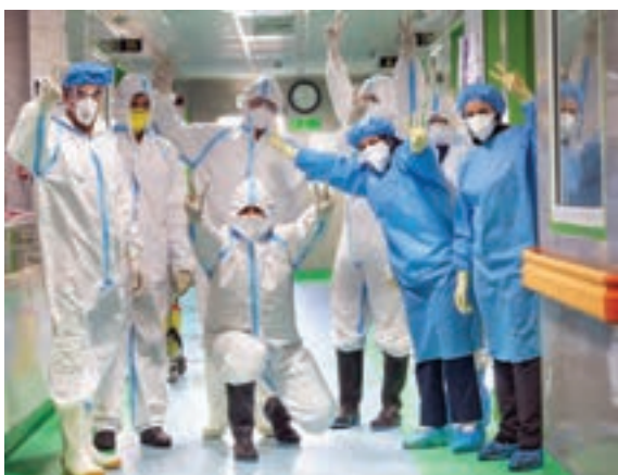
همیاری و مجاهدت کادر درمانی کشور (پزشکان، پرستاران و...) برای مقابله با بیماری کرونا