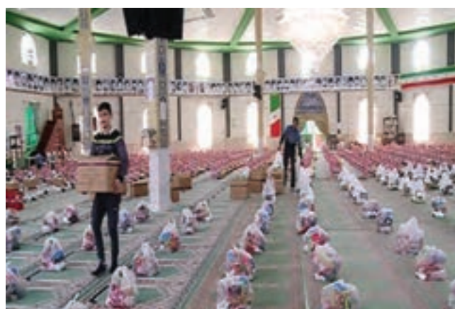
کمک‌های مؤمنانه مردم ایران به هم‌وطنان خود در هنگام بحران‌ها و بروز مشکلات مختلف در کشور