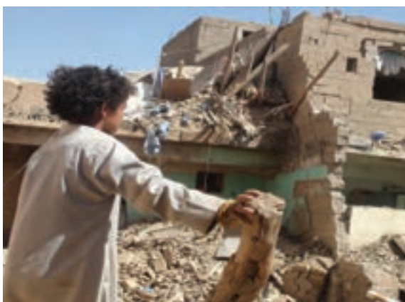
بمباران مردم مظلوم یمن توسط حاکمان سعودی و هم‌پیمان‌های آنها

برای مثال هر روزه شاهد هستیم که مردم فلسطین در اثر حملات ناجوانمردانه رژیم اشغالگر قدس، زخمی می‌شوند و یا به شهادت می‌رسند یا در خبرها می‌شنویم مردم برخی کشورها در آسیا و آفریقا به خاطر خشک‌سالی یا فقر و جنگ که گاهی ناشی از دخالت کشورهای زورگو است، کشته شده یا می‌شوند. با شنیدن این خبرها می‌گوییم: ای کاش آنجا بودیم و به انسان‌های خسارت‌دیده و مظلوم، کمک می‌کردیم.