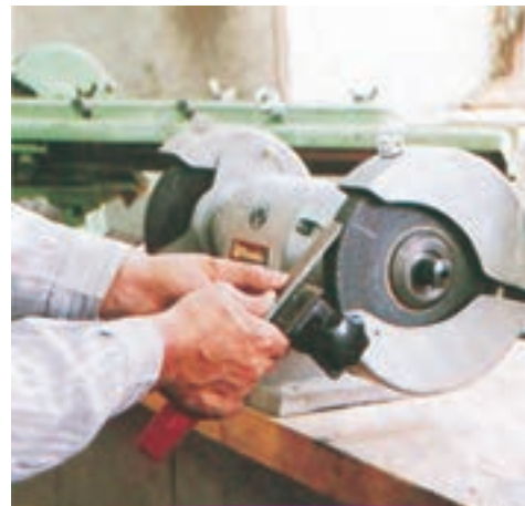
کارگران باید برای حوادث ناشی از کار، بیمه شوند تا اگر حادثه‌ای برای آنها پیش آمد بتوانند هزینه‌های درمان و یا از کارافتادگی دریافت کنند.