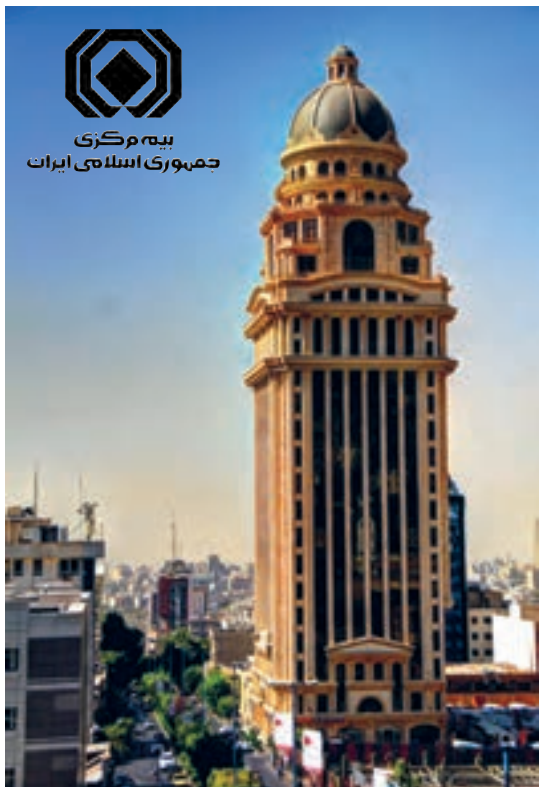
ساختمان بیمه مرکزی در تهران

کلیه مؤسسات بیمه زیر نظر «بیمه مرکزی جمهوری اسلامی ایران» فعالیت می‌کنند. بیمه مرکزی قوانین و مقررات لازم را برای مؤسسات بیمه تدوین می‌کند و هدایت و نظارت بر فعالیت و عملکرد آن‌ها را به عهده دارد. بیمه مرکزی نظارت می‌کند تا مؤسسات بیمه، وظایف خود را به درستی انجام دهند و مشتریان نیز از نحوه کار آنها رضایت داشته باشند.