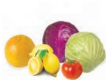
کلم، گوجه لیمو پرتقال