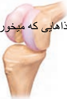
شکل ۴- پروتئین در غضروف و استخوان نیز وجود دارد.

چرا باید در غذاهایی که می خوریم به اندازه ی کافی پروتئین باشد؟