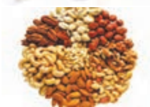
شکل ۹- معمولاً بین وعده های اصلی، خوراکی های متفاوتی می خوریم. این خوراکی ها میان وعده مناسبی اند.

مورد نیاز بدنتان را تأمین می کند، تغذیه سالمی دارید. افزون بر این تغذیه ای سالم است که غذاها به روش بهداشتی و سالم تهیه شده باشند. شاید غذاهای سرخ شده با روغن خوش مزه تر باشند؛ اما غذاهای آب پز و بخارپز سالم ترند. رفتارها و عادات های غذایی ما در سلامت تغذیه و در نتیجه سلامت بدن ما تأثیر زیادی دارند. خوردن خوراکی هایی مانند، پفک، شکلات و شیرینی بین وعده های غذا از عادات های نادرست است که برای سلامت ما زیان دارد در حالی که میوه ها، میان وعده سالمی هستند (شکل ۹). شما چه معیارهای دیگری برای تغذیه سالم می شناسید؟