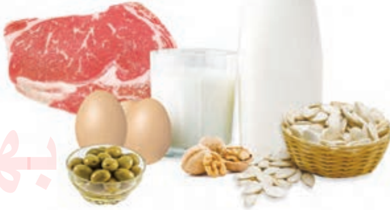
شکل ۳- این خوراکی ها چربی دارند. چربی هم در گیاهان و هم در جانوران وجود دارد. چربی هایی مانند روغن گردو و زیتون برای سلامتی مفیدند.

چرا پزشکان توصیه می کنند از چربی های جامد کمتر مصرف کنیم؟