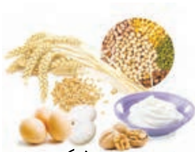
خامه، تخم مرغ، گردو، کدوم، ذرت

ویتامین های محلول در آب را نام ببرید و چه فایده ای دارند؟