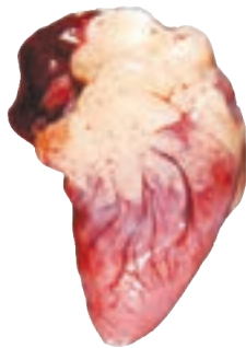
شکل ۲- قلب و چربی اطراف آن

چربی کم مصرف کنیم و از چربی مایع استفاده کنیم