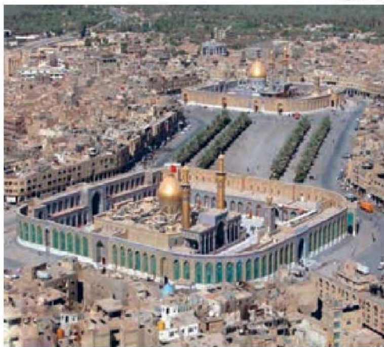
○ حرم حضرت امام حسین علیه السلام و حضرت ابوالفضل العباس علیه السلام در کربلا (بین الحرمین)

اینکه نیم قرن بعد از رحلت رسول خدا، فرد فاسد و گنه کاری چون یزید به عنوان خلیفه مسلمانان به قدرت رسید، نشان می دهد که جامعه اسلامی دچار انحراف بزرگی شده بود. فقط حرکتی عظیم مانند قیام کربلا و شهادت امام حسین و فرزندان، بستگان و یارانش می توانست از گسترش این انحراف جلوگیری کند.