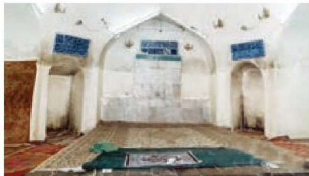
○ خانه منسوب به حضرت علی (علیه السلام) در کوفه