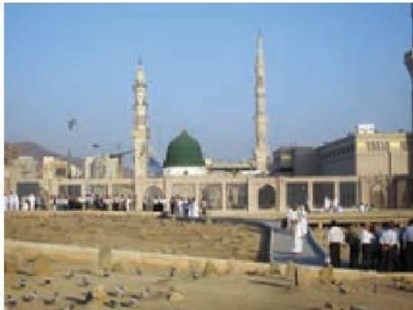
○ قبرستان بقیع، محل دفن امام حسن (علیه السلام)