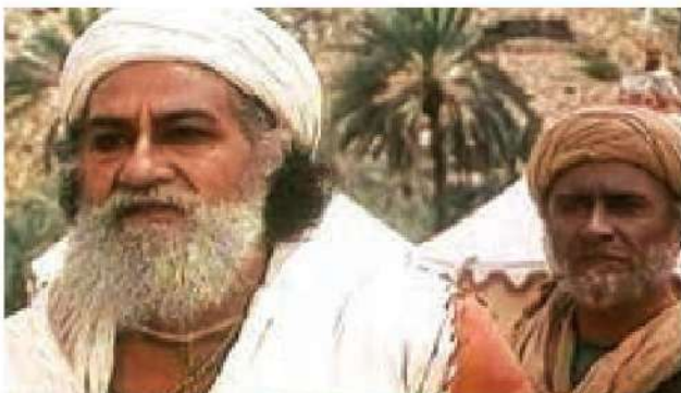
○ صحنه ای از مجموعه تلویزیونی تاریخی امام علی (علیه السلام)؛ آیا شما این مجموعه را دیده اید؟

معاویه پسر ابوسفیان که از زمان خلافت عمر حاکم شام (سوریه امروزی) بود، اعلام کرد در صورتی از امام اطاعت می کند که حکومت شام و مصر به او واگذار شود؛ اما امام با شناختی که از دشمنی امویان با اسلام و پیامبر داشت فرمود: خداوند دوست ندارد که من «گمراه کنندگان» را یاور خود قرار دهم.