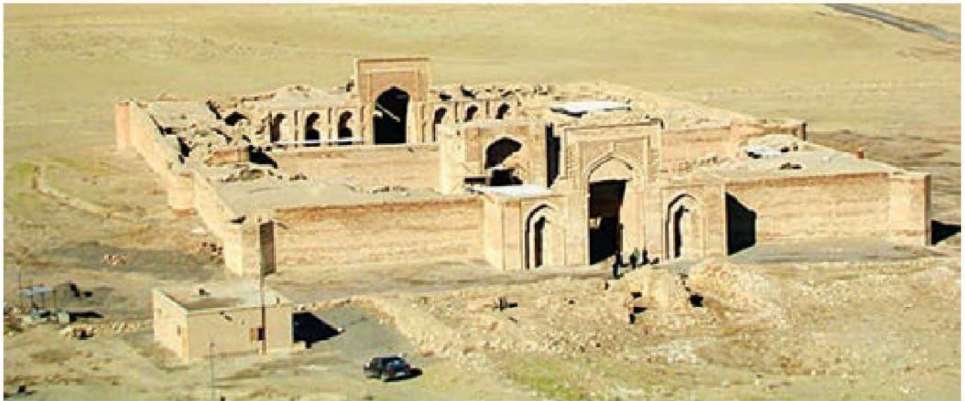
○ کاروانسرای شرف در نزدیکی سرخس (استان خراسان رضوی)