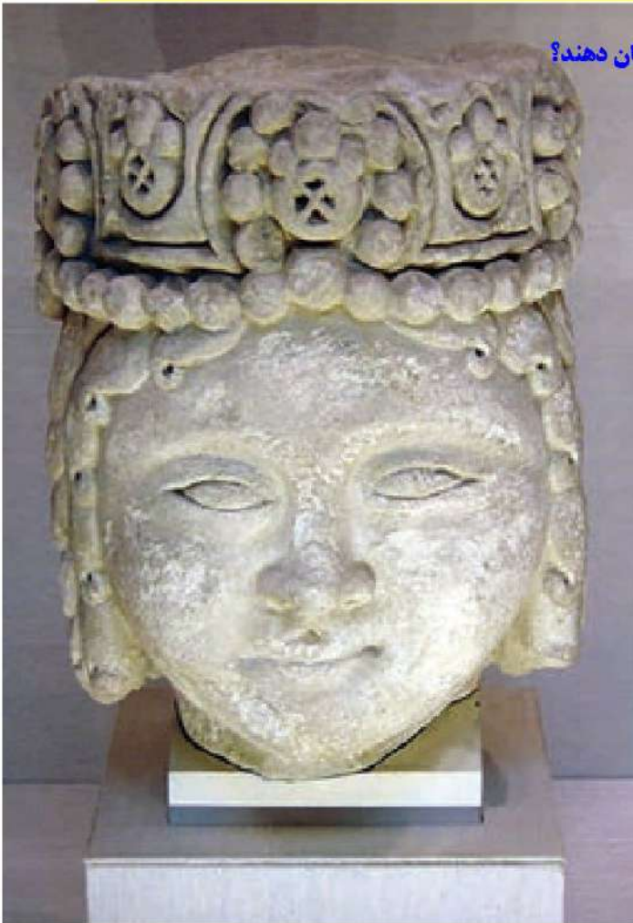
○ سردیس شاهزاده سلجوقی

«عمیدالملک گندی» وزیر سلطان طغرل نقشی مؤثر در موفقیت‌های این سلطان داشت.