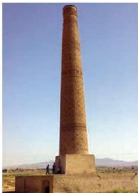
○ میل خسروگرد در نزدیکی سبزوار

معماران ایرانی در دوره سلجوقیان، بناهای زیبایی در ایران ساختند و معماری به اوج شکوفایی خود رسید. در ساختن مساجد ایرانی، ابتکار خاصی به کار رفت و حیاط و چهار ایوان اطراف آن معمول گردید. در ساختن انواع گنبدها، برج‌ها و مناره‌ها، کاروانسراها و مدارس نیز الگوهای جدیدی در معماری به کار گرفته شد. در قرن‌های پنجم تا هشتم هجری کدام هنرهای معماری به اوج زیبایی و شکوفایی رسید. در قرن‌های پنجم تا هفتم هجری، «اجرکاری» و «کاشی‌کاری» در بناها به اوج زیبایی و شکوفایی رسید. کاشی‌کاری از ابتکارات مهم معماران ایرانی برای تزیین بناها بود.