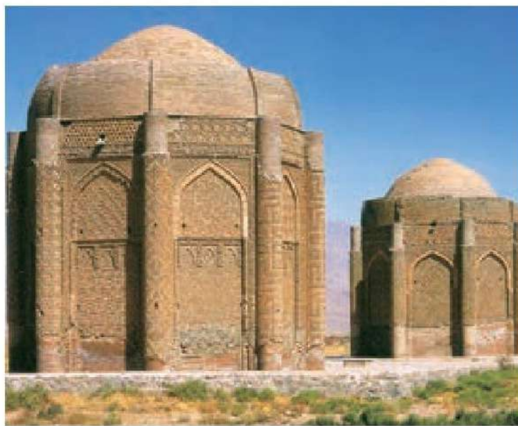
○ برج‌های خرقان در شهرستان آوج در استان قزوین