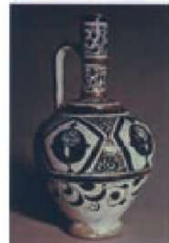
○ ظروف شیشه‌ای، فلزی و سفالی متعلق به دوره‌های سلجوقی و خوارزمشاهی