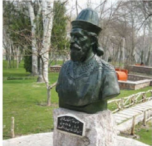
○ تندیس خواجه نظام‌الملک در مشهد