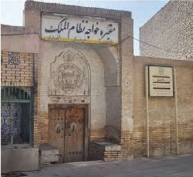
○ مقبره منسوب به خواجه نظام‌الملک در اصفهان

یکی از وظایف مهم وزیران چه بود؟ یکی از وظایف مهم وزیران، تنظیم رابطه سلطان با خلیفه و دیگر فرمانروایان بود.