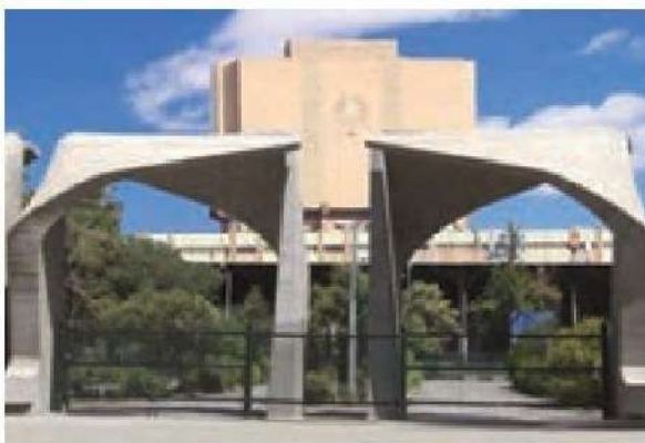
○ در حال حاضر بسیاری از هزینه های پژوهشی در برخی از برترین دانشگاه های جهان و ایران، از طریق سرمایه های وقفی، تأمین می شود.