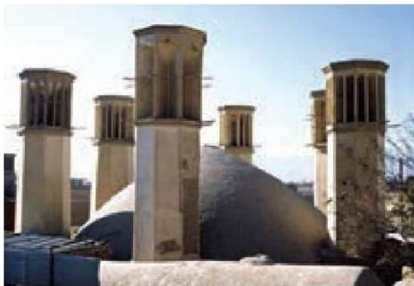
○ یک آب انبار بزرگ و قدیمی در ایران: آب انبارها در کنار کاروانسراها و مساجد، از موقوفاتی هستند که در فرهنگ و پدیده های جغرافیایی شهرها تأثیر گذار بودند.