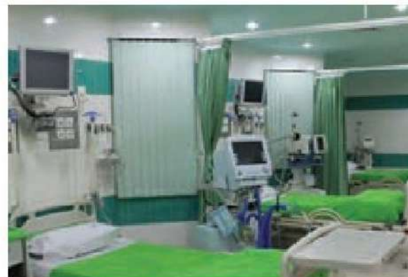
○ بیش از ۲۵۰۰ بیمارستان و درمانگاه وقفی در کشور ما وجود دارد.