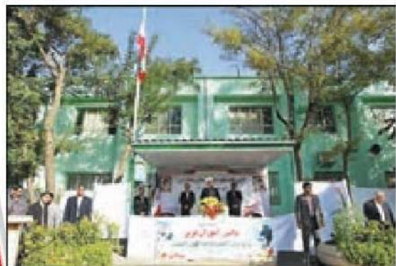
حضور رئیس‌جمهور در مراسم آغاز سال تحصیلی جدید

ریاست جمهوری از برمشغله‌ترین امور کشور است. یک رئیس‌جمهور از بامداد تا شامگاه و حتی روزهای تعطیل مشغول به انجام وظایف و رسیدگی به امور مختلف کشور است.