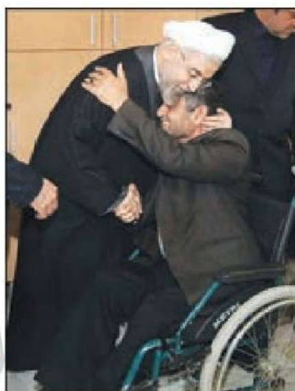
دیدار رئیس‌جمهور با جانبازان جنگ تحمیلی