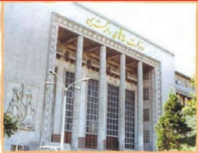
○ دادگستری مرجع رسمی رسیدگی به شکایات مردم و سازمان‌هاست و زیر نظر رئیس قوه قضائیه اداره می‌شود.

ممکن است باعث آسیب رساندن به خود و دیگران شوند و باعث افزایش اختلاف و بی نظمی و آشفتگی شوند.