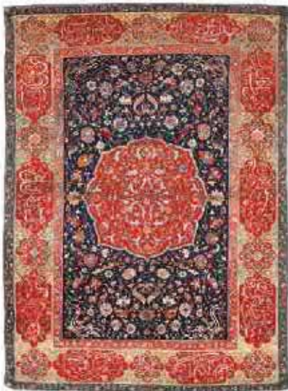
قالیچه نفیس متعلق به عصر صفوی