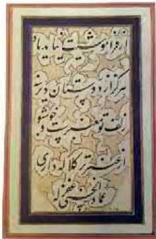
نمونه‌ای از خط نستعلیق میرعماد حسنی قزوینی، خوشنویس مشهور عصر صفوی

هنر: در زمان صفویان، ذوق و استعداد هنری ایرانیان شکوفا شد و هنرمندان بزرگی در رشته‌های مختلف هنری از جمله معماری، نقاشی، خوشنویسی، کتاب‌آرایی* و خاتم‌کاری شهرت یافتند. این هنرمندان خوش‌ذوق، آثار بسیار زیبا و نفیسی از خود به یادگار گذاشته‌اند.