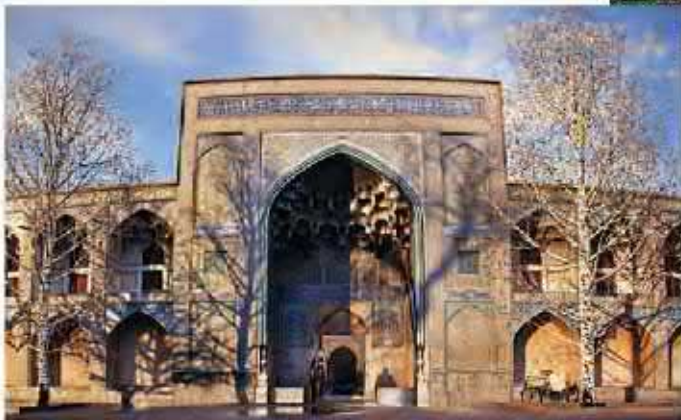
مدرسه چهارباغ در اصفهان