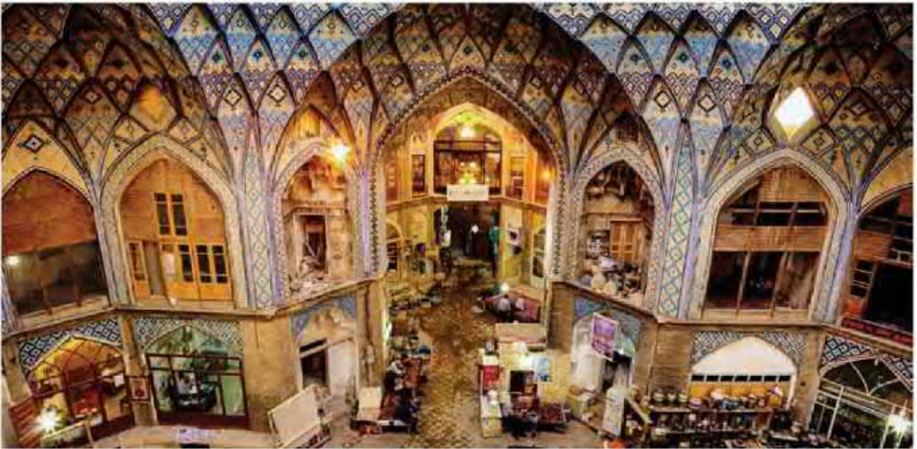
بازار قیصریه مربوط به دوره صفوی