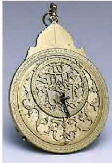
اسطرلاب افلاك نما