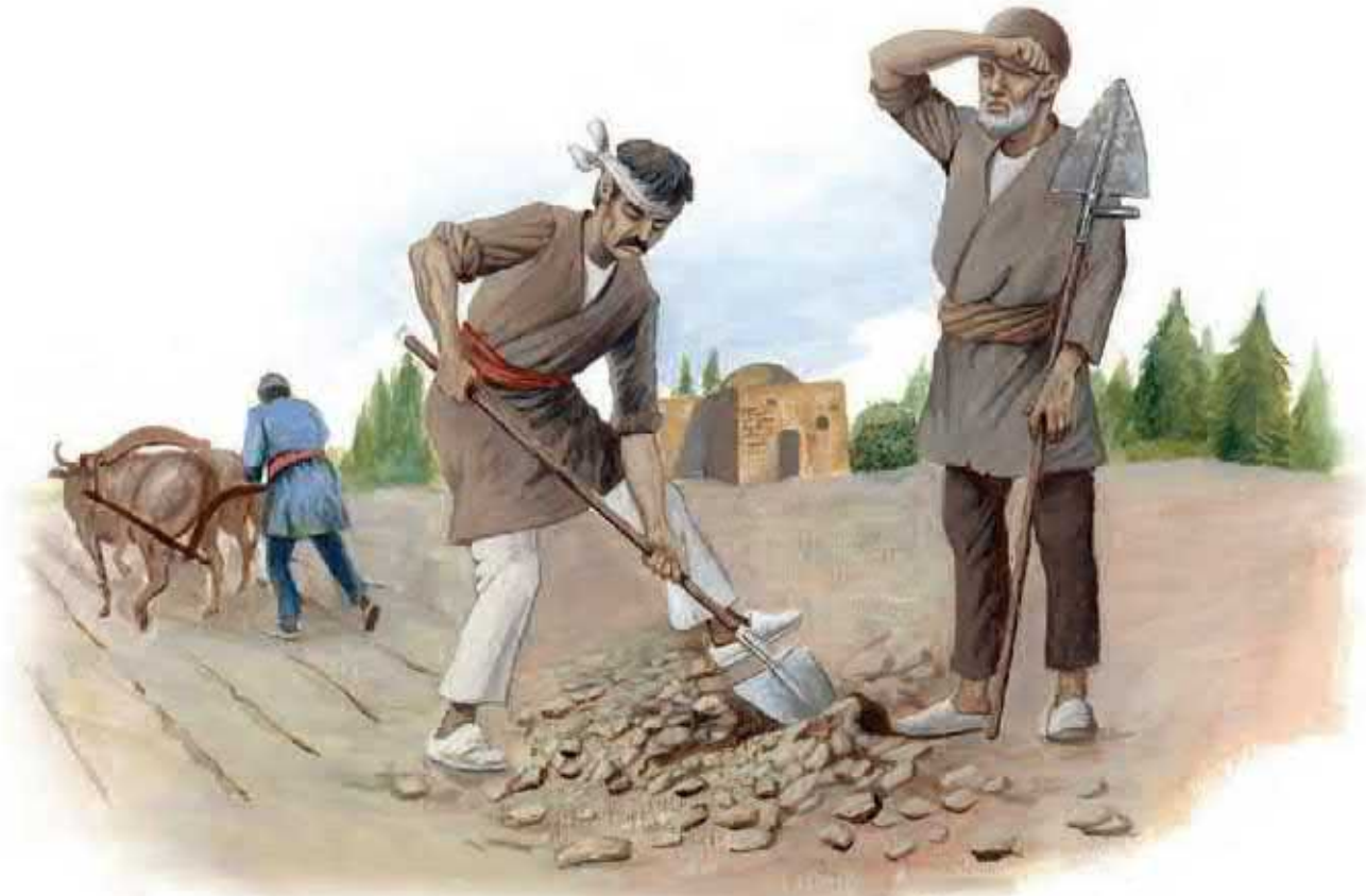
زندگی روستایی در عصر صفوی

در دوران صفویه به دلیل وجود حکومت مرکزی نیرومند و برقراری نظم و امنیت در سراسر کشور، شرایط مناسبی برای رونق زندگی اجتماعی و اقتصادی پدید آمد. جمعیت ایران در آن دوره حدود ۳۰ میلیون نفر تخمین زده می‌شود. روستاییان و کوچ‌نشینان به ترتیب بیشترین ساکنان ایران را تشکیل می‌دادند. آنها به کشاورزی، دامداری و صنایع دستی اشتغال داشتند. عقیقه شاردن در مورد دهقانان صفوی چه بوده است؟ به عقیده جهانگردان اروپایی، از جمله شاردن، وضع زندگی دهقانان ایرانی در دوره صفویه به مراتب بهتر از وضع دهقانان در مناطق حاصلخیز اروپا بوده است. یکی از منابع عمده درآمد حکومت صفوی، مالیاتی بود که از کشاورزان و دامداران می‌گرفتند.