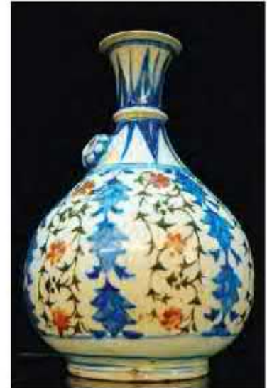
کوزه سفالی لعابداد