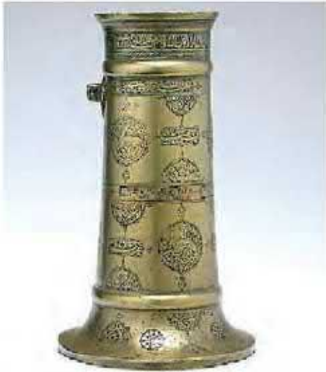
بایانه فانوس برنجی

صنعتگران ایرانی در صنایع کاشی، چینی، جرم، جواهر، رنگ، صابون و جنگ افزارهای سنتی از قبیل شمشیر و کمان نیز پیشرفت کرده بودند و می توانستند کالاهای مرغوبی بسازند.