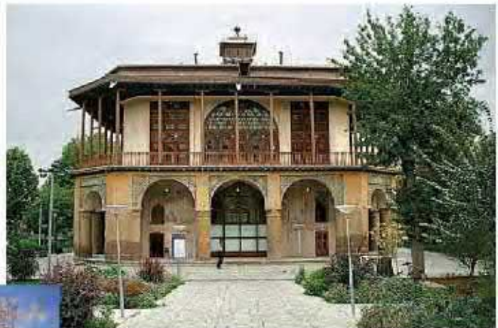
کاخ چهلستون در قزوین

در دوران حکومت صفویان، ایرانیان بار دیگر توانستند استعدادها و توانایی های علمی، فرهنگی و هنری خود را آشکار کنند. در آن دوران، معماران و مهندسان شهرساز ایرانی مسجدها، مدرسه ها، کاخ ها، پل ها و کاروانسراهای عظیم و باشکوهی ساختند و در تزیین آنها انواع هنرها را به کار بردند. در کتاب مطالعات اجتماعی ششم با برخی از جلوه های هنر و معماری ایران در عصر صفوی آشنا شدید. در این درس به جنبه های دیگری از پیشرفت های علمی و فرهنگی ایرانیان در آن دوره می پردازیم.