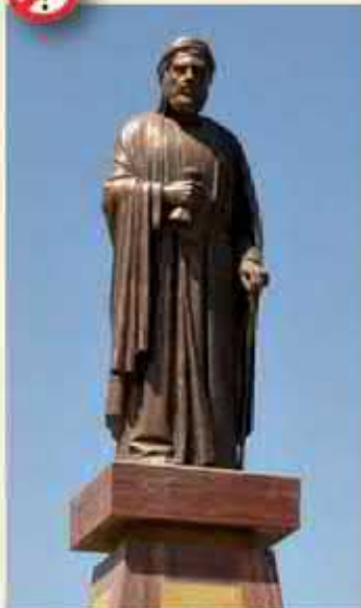
تندیس شیخ بهایی

بهاء‌الدین محمد، معروف به شیخ بهایی از دانشمندان مشهور سده‌های ۱۰ و