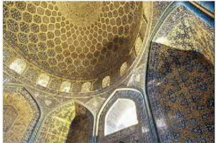
مسجد شیخ لطف الله، اصفهان