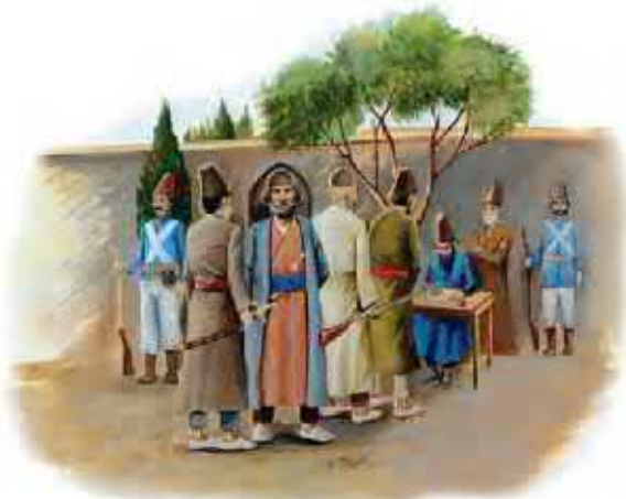
نبت نام داوطلبانه ایرانیان برای دفاع از میهن خود

خود وارد جنگ شد و با شکست دادن سپاه ایران، عهدنامه ترکمان جای را در عهد نامه ترکمان جای چه مناطقی از ایران جدا شد؟ - که تنگین تر از قرارداد گلستان بود - به کشور ما تحمیل کرد. بر اساس این قرارداد، سرزمین های ایرانی شمال رود ارس به تصرف روسیه درآمد و همچون معاهده گلستان، ایران از داشتن کشتی جنگی در دریای مازندران محروم گردید و مجبور به پرداخت غرامت شد.