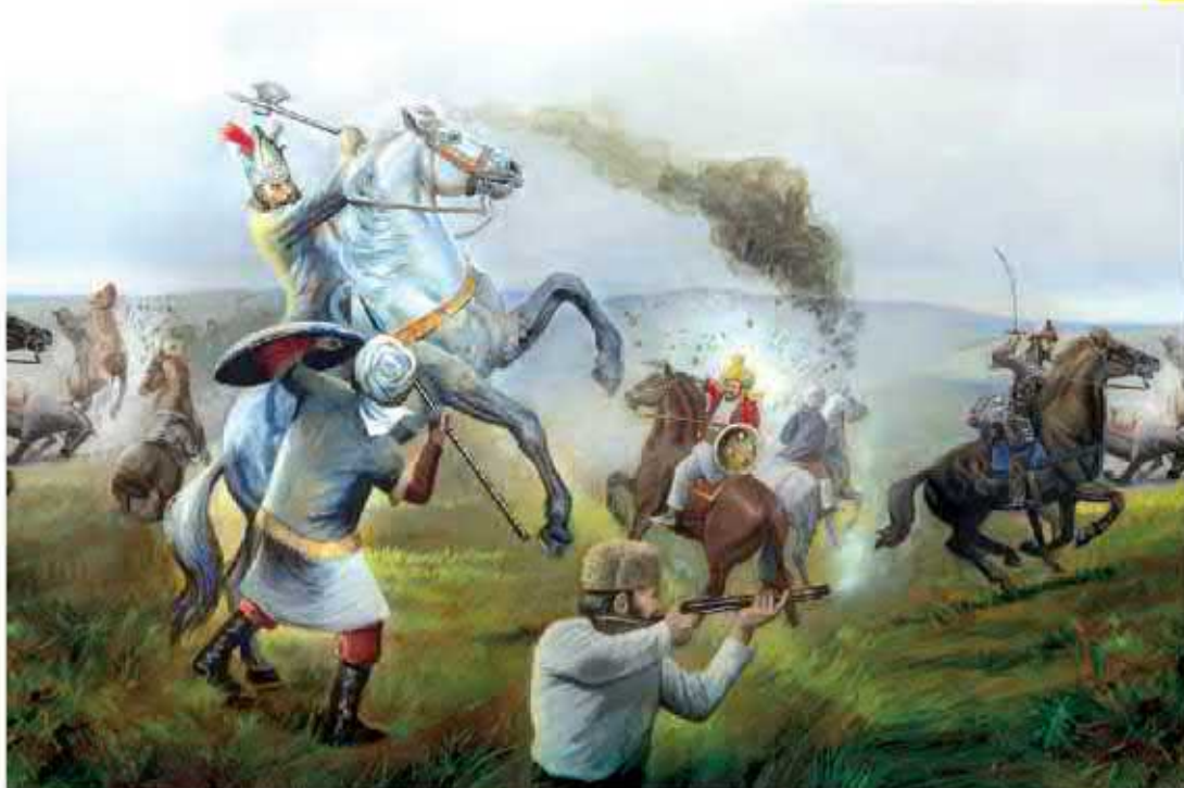
صحنه رزم نادر با دشمنان

در چنین شرایطی، نادر که سرداری از ایل افشار بود با سپاهیان، نخست مهاجمان افغان را سرکوب و تار و مار کرد و سپس نیروهای روسیه و عثمانی را از ایران بیرون راند. نادر پس از این پیروزی‌ها، بر تخت شاهی نشست. بدین ترتیب، سلسله افشاریه پایه‌گذاری شد.