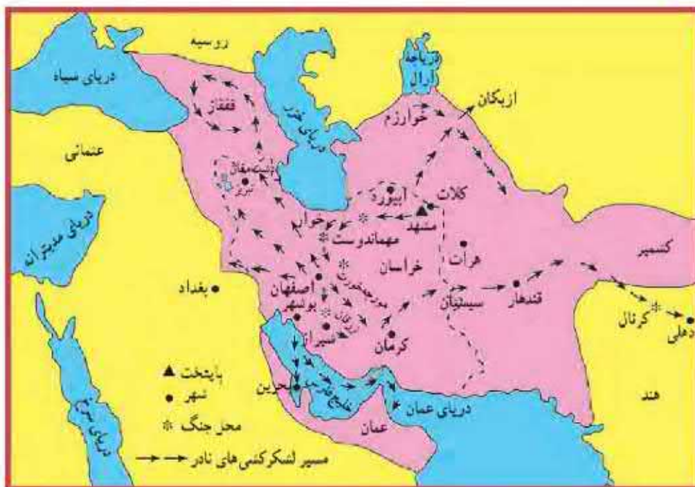
قلمرو ایران در زمان نادر شاه افشار

در سال‌های پایانی حکومت نادر، نافرمانی‌ها و شورش‌های بیابانی تأثیر روانی نامطلوبی بر او گذاشت. او که به اطرافیان و سرداران خود بدگمان شده بود، به رفتارهای خشونت‌آمیز و بی‌رحمانه روی آورد. در نتیجه، فرماندهان سپاه نادرشاه که از جان خود می‌ترسیدند، او را به قتل رساندند. به دنبال قتل نادرشاه، ایران بار دیگر به صحنه جنگ حاکمان محلی و سران ایل‌ها تبدیل شد.