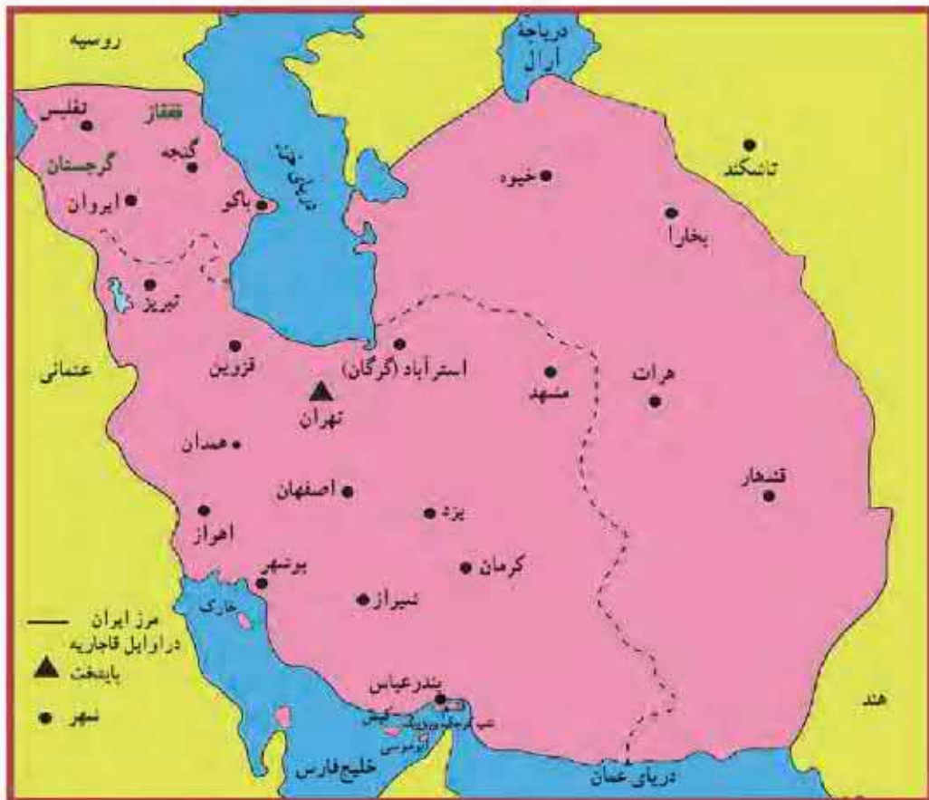
قلرو ایران در اوایل حکومت قاجاریه