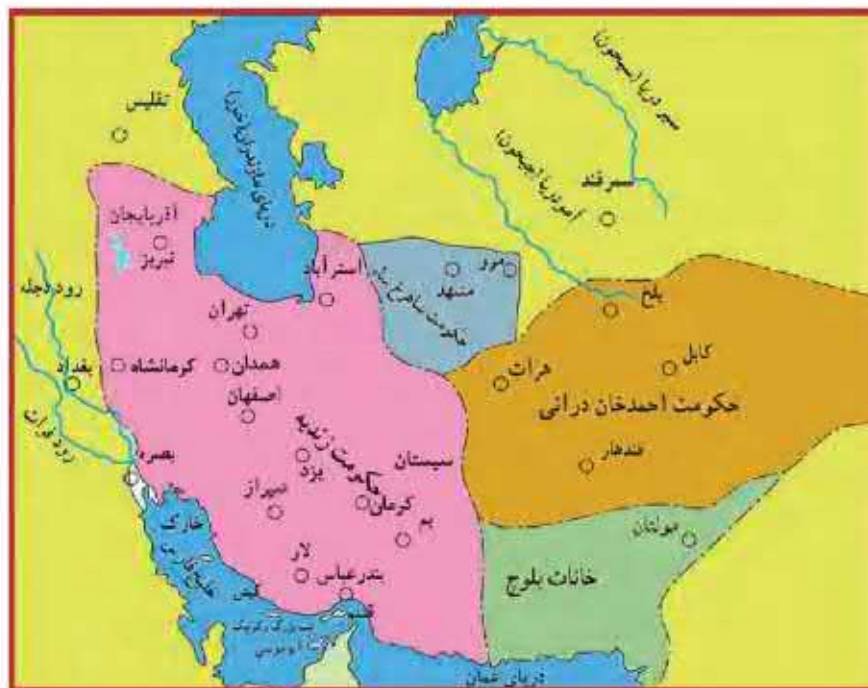
قلمرو ایران در زمان زندیه

دوران فرمانروایی کریم خان سی سال طول کشید. در این دوران، ثبات و آرامش نسبی در سراسر کشور به وجود آمد و در نتیجه، اوضاع اجتماعی و اقتصادی بهتر شد. بناهای مهمی مانند بازار وکیل، مسجد وکیل، حمام وکیل و ارگ کریم خان در شیراز، پایتخت زنده، ساخته شد و فعالیت‌های علمی و فرهنگی در آن شهر رونق گرفت. قدرت گرفتن خاندان زند در ایران، تقریباً مصادف با تسلط انگلستان بر هندوستان بود. این اتفاق سبب شد انگلیسی‌ها بتوانند بر اقیانوس هند و دریاهای جنوبی ایران دسترسی بیشتری داشته باشند. به این ترتیب نفوذ تجاری آنها در ایران بیشتر شد. با مرگ کریم خان، افراد خاندان او برای کسب قدرت با یکدیگر درگیر شدند و بار دیگر، مردم نظاره‌گر جنگ داخلی کشور شدند.