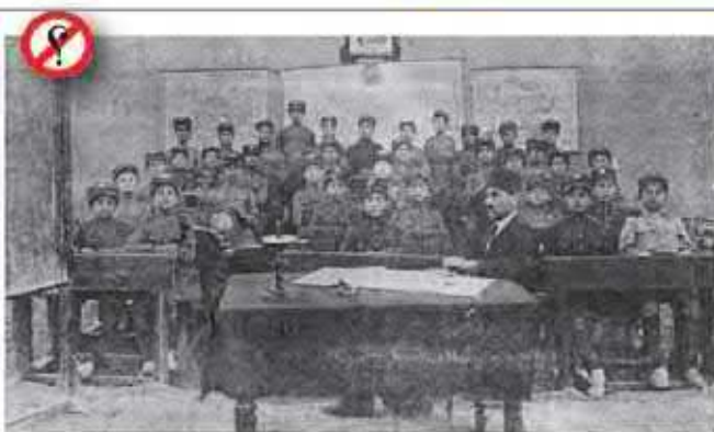
عکسی از کلاس مدارس جدید در دوره قاجار