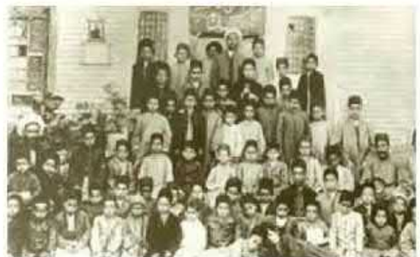
عکسی از مکتب‌خانه‌ای در اصفهان، در دوره قاجار

در مدارس جدید، دانش‌آموزان در دوره ابتدایی در سورهایی از قبیل قرآن، شریعت، فارسی، دیکنه، حساب، نصاب (مقدمه زبان عربی)، مهندسی می‌آموختند. در دوره متوسطه نیز همین دروس به اضافه فیزیک، شیمی، ریاضی، جبر، مثلثات، طب، زبان فرانسه، تاریخ و جغرافیا توسط معلمانی که اغلب فارغ‌التحصیل دارالفنون و یا تحصیل کرده اروپا بودند، تدریس می‌شدند.