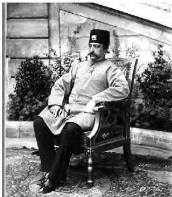
ناصرالدین شاه قاجار

به دستور چه کسی امیرکبیر به قتل رسید؟ سرانجام، ناصرالدین شاه که با حدود ۵ سال حکومت ضعیف خود، عامل عقب ماندگی کشور شده بود، تحت تأثیر برخی توطئه چینی ها، دستور قتل امیرکبیر را داد و ایران را از خدمات ارزشمند او محروم کرد.