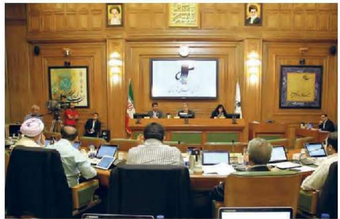
شورای اسلامی شهر تهران