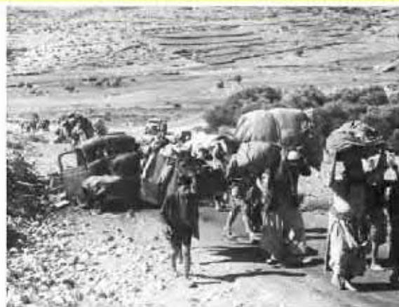
مهاجرت فلسطینی‌ها از خانه و وطنشان

در مهاجرت اجباری، افراد بدون میل خود و به دلایلی چون قحطی، خشکسالی و دیگر حوادث طبیعی و یا جنگ‌ها و درگیری‌های سیاسی مجبور به ترک محل زندگی خود می‌شوند؛ مانند مهاجرت اجباری مردم فلسطین از سرزمین‌های اشغالی یا مهاجرت گروهی از مردم افغانستان، سوریه یا عراق به کشورهای همسایه به دلیل شرایط جنگ و اشغال نظامی کشورهاشان توسط متجاوزان اسرائیلی و آمریکایی.