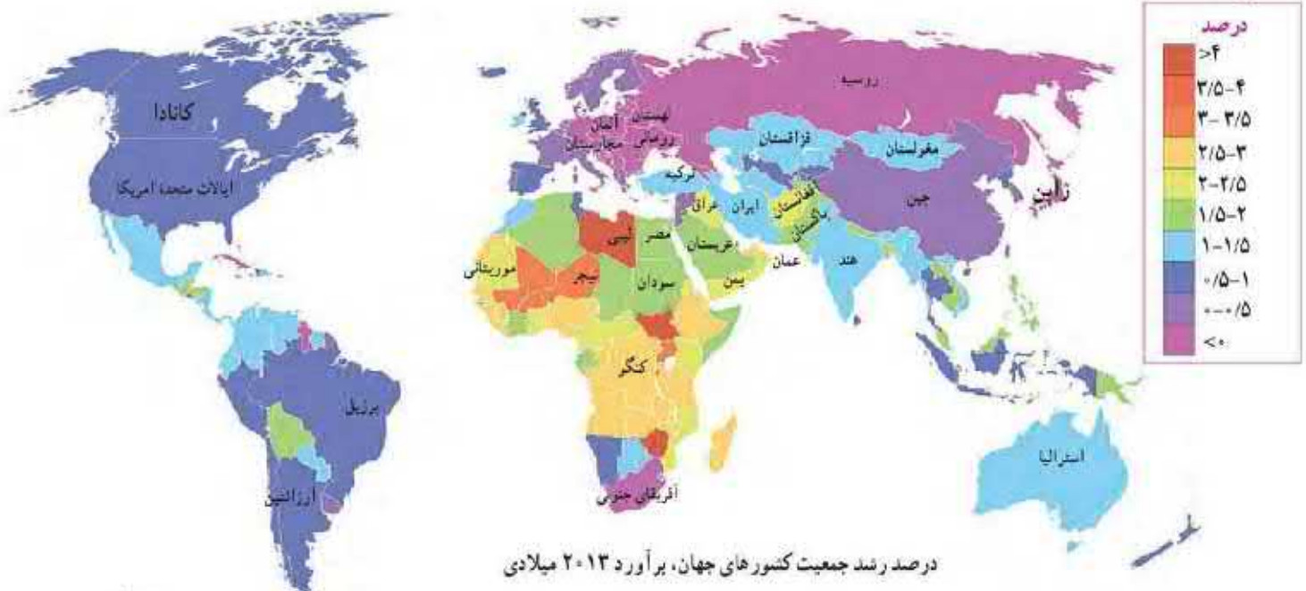
درصد رشد جمعیت کشورهای جهان، برآورد ۲۰۱۳ میلادی