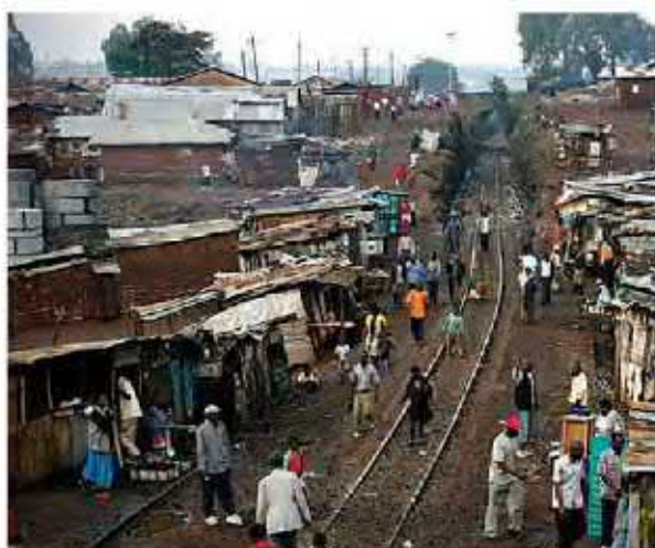
زاغه‌نشینی، پدیده‌ای گسترده در اطراف شهرهای بزرگ جهان