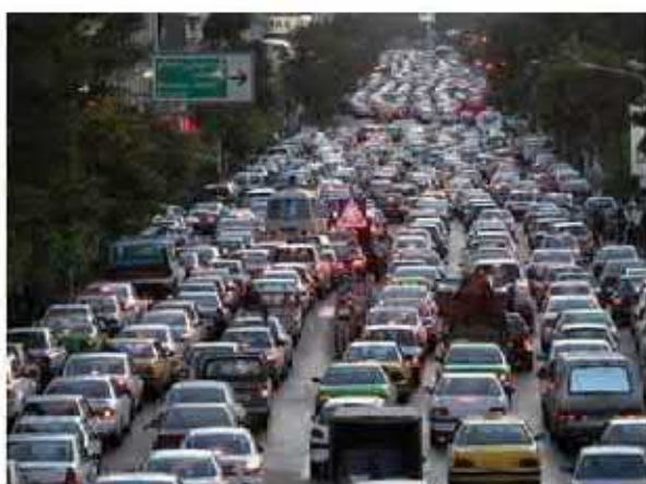
شدامد(ترافیک)سنگین در شهرهای بزرگ

امروزه مدیران و برنامه‌ریزان شهری تلاش می‌کنند راه‌حل‌هایی برای این مسائل و مشکلات بیابند که یکی از آنها تقویت امکانات و اقتصاد روستایی است.