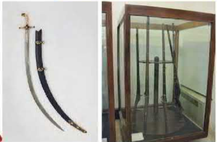
نمونه‌ای از سلاح‌های دوره صفویه

تا زمان شاه عباس اول، سران ایل قزلباش حاکم ولایت‌های مختلف ایران بودند. شاه عباس اول برای تقویت حکومت مرکزی و جلوگیری از نافرمانی و بی‌نظمی سران ایل قزلباش، حکومت ولایت‌ها را از آنان گرفت و به افرادی غیر از قزلباش‌ها سپرد. همچنین در کنار سپاه قزلباش، سپاه جدیدی از افراد غیر قزلباش تشکیل داد و با کمک گرفتن از اروپاییان، این سپاه را به تفنگ و توپ مجهز کرد.