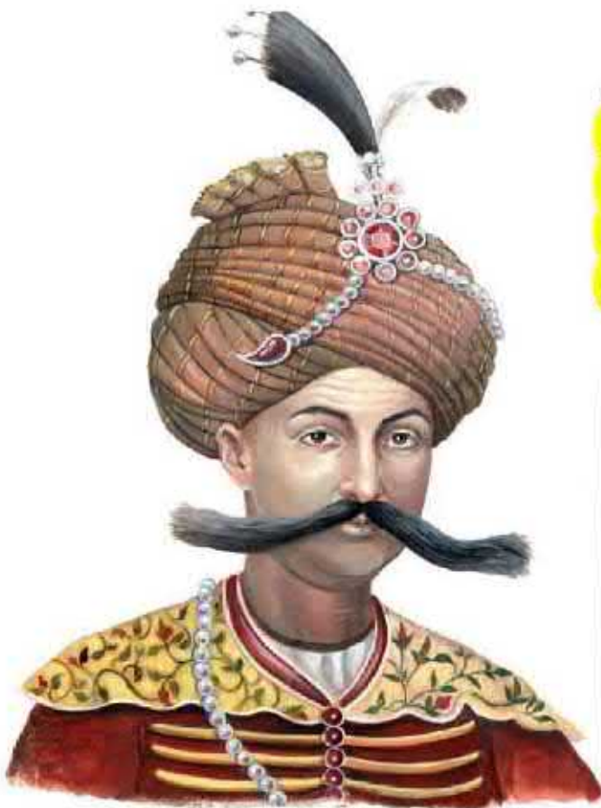
شاه عباس اول صفوی

تا زمان شاه عباس اول، سران ایل قزلباش حاکم ولایت‌های مختلف ایران بودند. شاه عباس اول برای تقویت حکومت مرکزی و جلوگیری از نافرمانی و بی‌نظمی سران ایل قزلباش، حکومت ولایت‌ها را از آنان گرفت و به افرادی غیر از قزلباش‌ها سپرد. همچنین در کنار سپاه قزلباش، سپاه جدیدی از افراد غیر قزلباش تشکیل داد و با کمک گرفتن از اروپاییان، این سپاه را به تفنگ و توپ مجهز کرد.