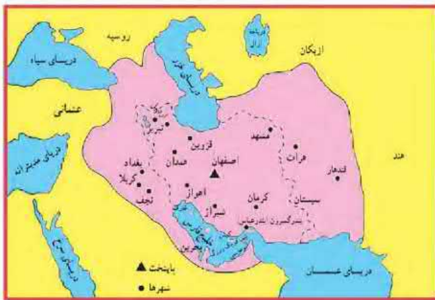
ایران در زمان صفویان (شاه عباس)

صفویان برای دفاع از یکبارجگی جغرافیایی ایران، بازها با دشمنان خارجی رو به رو شدند. از یک ها در شرق و عثمانی ها در غرب مهم ترین دشمنان آنها بودند. سلطان عثمانی که از شکل گیری سلسله قدرتمند، مستقل و شیعه مذهب صفویه ناخشنود بود، با سپاهی عظیم راهی ایران شد. در جنگی که میان سپاهیان دو کشور ایران و عثمانی در جالدران (در نزدیکی شهر خوی امروزی) رخ داد، شاه اسماعیل و سربازانش شجاعت زیادی نشان دادند اما سپاه عثمانی به کمک سلاح های آتشین مانند توپ و تفنگ که سپاه ایران از آنها بی بهره بود، پیروز شد. پس از جنگ جالدران، تیریز به اشغال عثمانی ها در آمد اما مقاومت و مبارزه مردم آنها را وادار به عقب نشینی کرد. پس از شاه اسماعیل چه کسی به قدرت رسید؟ شاه تهماسب چه اقداماتی داشت؟ پس از شاه اسماعیل پسرش، تهماسب، به حکومت رسید. او با سر و سامان دادن به اوضاع داخلی و دفع حمله های ازبکان و دولت عثمانی، موفق شد حکومت صفوی را تثبیت و تحکیم کند. کنچرنامه تهماسب پایتخت را از تبریز به قزوین انتقال داد؟ زیرا تبریز همواره در معرض هجوم سپاه عثمانی بود. همچنین او، روابط مسالمت آمیزی با کشورهای همسایه و مسلمان خود، برقرار کرد. در دوره شاه تهماسب، برخی فقهای بزرگ شیعه، جایگاهی علمی و جدی در اداره کشور پیدا کردند. چه کسی حکومت صفوی را به اوج قدرت رساند و چه اقداماتی داشت؟ سلسله صفوی در اوج قدرت: شاه عباس اول (پنجمین شاه صفوی) حکومت صفوی را به اوج قدرت رساند. او ازبک ها و عثمانیان را شکست داد و تا پشت مرزهای ایران عقب راند. همچنین، پایتخت را از قزوین به اصفهان - در مرکز ایران - منتقل کرد و برای آبادانی آن بسیار کوشید.