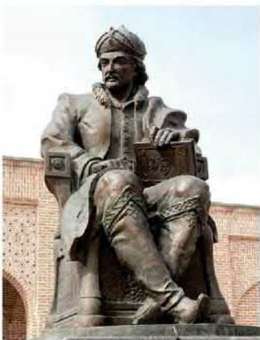
تندیس شاه اسماعیل اول صفوی

در ابتدای قرن ۱۰ ق یکی از نوادگان شیخ صفی به نام اسماعیل به قدرت