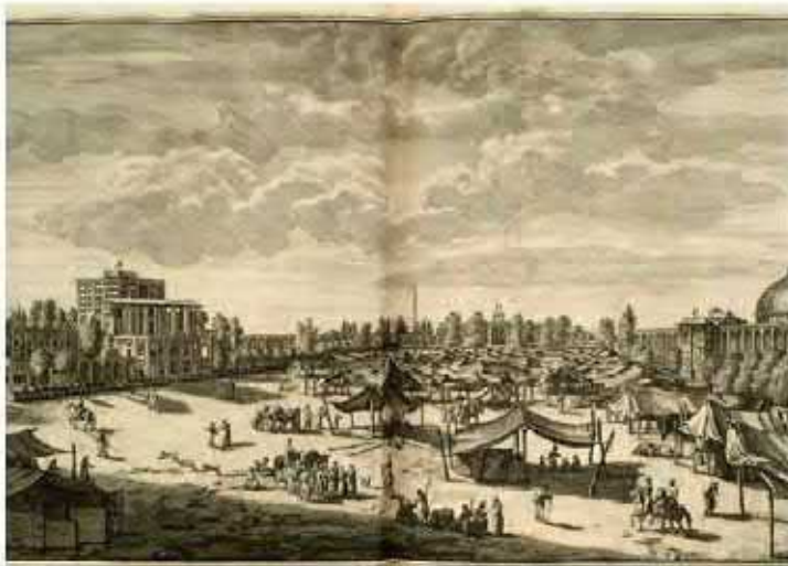
یک تقاضای قدیمی از میدان نقش جهان در دوران صفویه که نشانگر رونق تجاری در این دوره است.